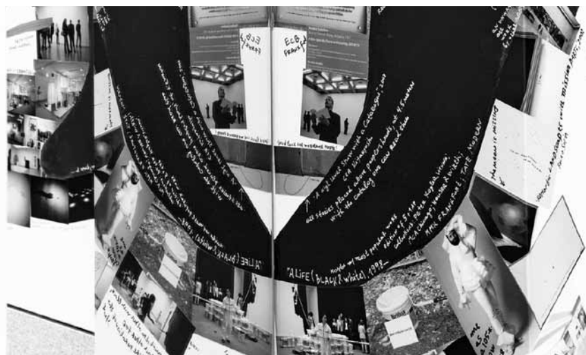
Le Mudam invite à l'exposition monographique de Nedko Solakov, artiste multidisciplinaire : « A Cornered Solo Show #1 », jusqu'au 18 avril 2022.