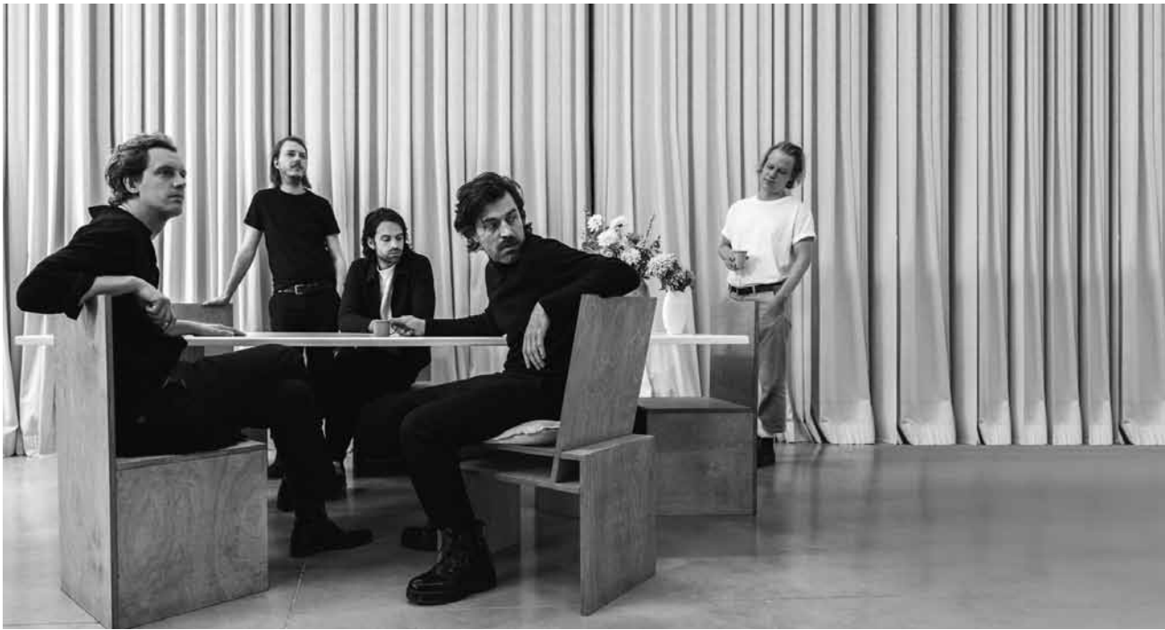
Apparemment, il y aura beaucoup à voir à l'Atelier, le 23 novembre : le groupe belge Balthazar y montera sur scène après sa pause café. Ouverture des portes dès 19h.

Juja Wang & Gautier Capuçon , œuvres de Debussy, Chostakovitch et Rachmaninov, Philharmonie, Luxembourg, 20h. Tél. 26 32 26 32. www.philharmonie.lu