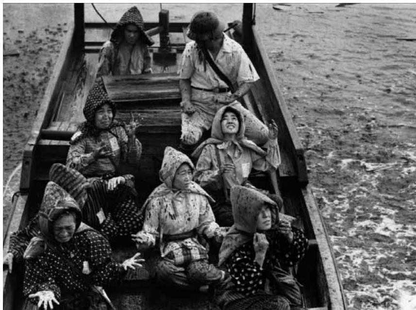
« Kuroi ame », sorti en 1989, raconte la vie d'une famille contaminé par la pluie noire radioactive après le bombardement atomique d'Hiroshima en 1945. À voir à la Cinémathèque, le 10 janvier à 20h30.

Nora entre en primaire lorsqu'elle est confrontée au harcèlement dont son grand frère Abel est victime. Tirillée entre son père qui l'incite à réagir, son besoin de s'intégrer et son frère qui lui demande de garder le silence, elle se trouve prise dans un terrible conflit de loyauté.