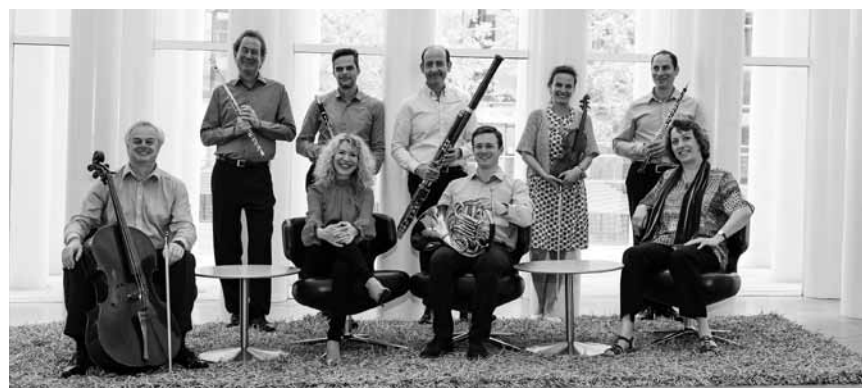
Ce dimanche 27 février à 17h, l'ensemble Kammerata Luxembourg joue des œuvres de Milhaud, Honegger et Auric au Centre des arts pluriels à Ettelbruck.

Programmation Zoom In : Au fil de l'eau, les marines de la collection Pescatore , promenade à travers l'art avec Nathalie Becker, Villa Vauban, Luxembourg , 19h. Tél. 47 96 49-00. www.villavauban.lu Inscription obligatoire : visites@2musees.vdl.lu