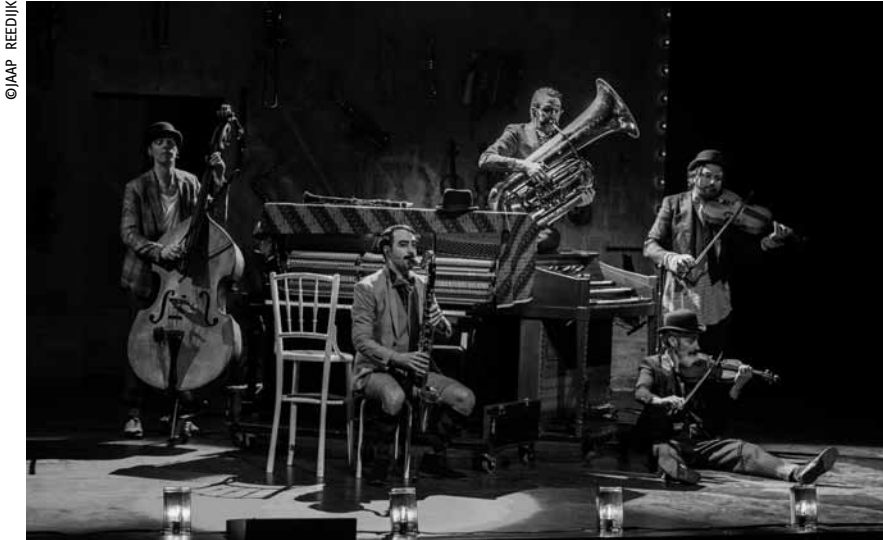
Tout droit venus des Pays-Bas au Cube 521, les clowns et musiciens de « Släpstick » y rendront le 11 mars un hommage nostalgique et endiablé au cinéma muet.

Coskun Percussion Trio , Weltmusik, Tufa, Trier (D), 20h. Tél. 0049 651 7 18 24 12. www.tufa-trier.de