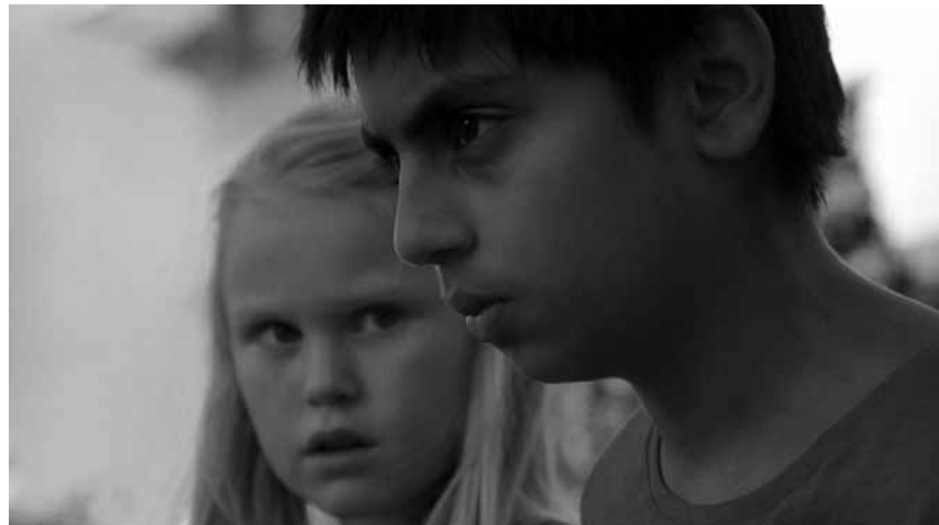
In „De uskyldige“ von Eskil Vogt stehen Kinder mit besonderen Kräften im Mittelpunkt, die sie nicht nur zum Guten einsetzen. Neu im Utopia.

In der Häschenschule werden erneut die Kandidaten zum sogenannten Meisterhasen ausgewählt - das sind die Häschen, die zu Ostern die Eier verstecken dürfen. Doch beim feierlichen Ritual mit dem Goldenen Ei geschieht Unerwartetes. Zuerst wird mit Max zum ersten Mal ein Großstadthase ausgewählt. Dann verfärbt sich das Goldene Ei auch noch schwarz. Um herauszufinden, was das bedeutet, müssen sich Max und seine Freunde mit einem überraschenden Partner zusammenschließen.