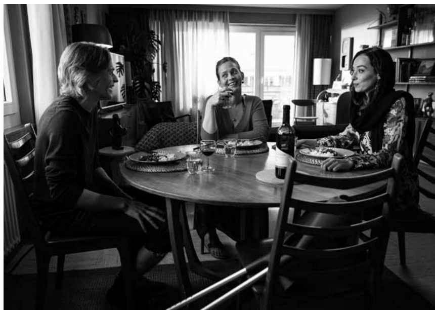
Trois personnages se retrouvent involontairement autour d'une table dans « Une histoire provisoire » : un film sur des crises personnelles et collectives ainsi que des rencontres enrichissantes. Aux Kulturhuef Kino, Le Paris, Scala, Starlight, Sura et Utopia.

Durch Zufall gerät die zurückhaltende Karen in eine Gruppe junger Leute, die sich zu einem radikalen Experiment entschieden hat. Angestachelt vom Spießhasser Stoffer geben sie sich in der Öffentlichkeit als Idioten aus und provozieren bei so genannten Behindertenausflügen durch