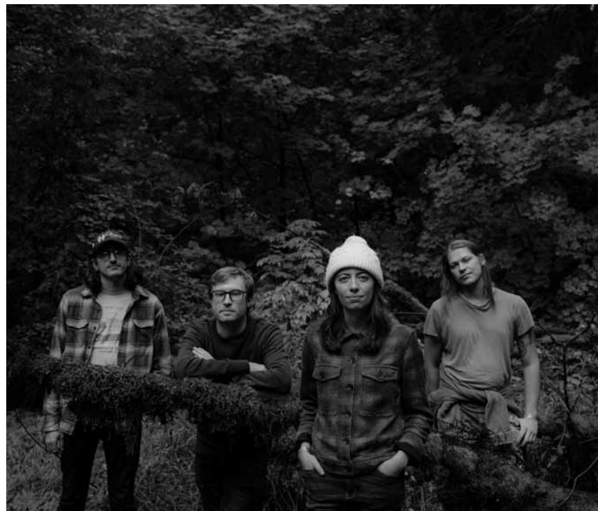
Il n'y a pas de rats sur cette image, mais elle et eux, ce sont les Ratboys : un groupe de rock indépendant invité aux Rotondes, le 9 mai à 20h30.

Monuments hystériques - quand l'histoire se raconte... , (> 10 ans), Neimënster, Luxembourg, 16h + 19h. Tél. 26 20 52-1. www.neimenster.lu