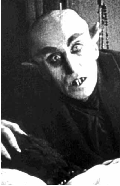
Attention aux crocs de « Nosferatu », le 27 mai : le film culte de Friedrich Wilhelm Murnau fera trembler la Cinémathèque.