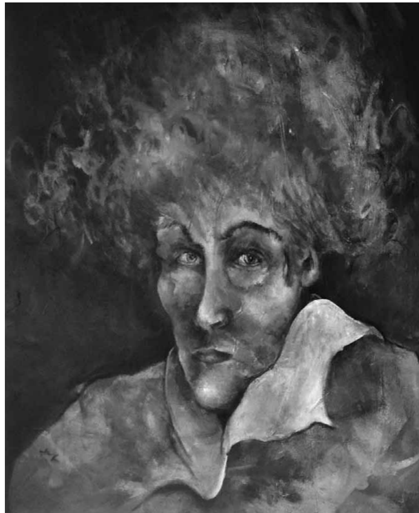
Die argentinische Künstlerin Marisa Zorgono zeigt in „El otro lado / Die andere Seite“ einen Querschnitt ihres künstlerischen Werdegangs, der von Intuition, Farben, Empfindungen und Natur bestimmt wurde. Die Ausstellung ist ab diesen Freitag, dem 20. Mai, in der Galerie im 1. Obergeschoss der Tufa zusehen.

Alle Rezensionen zu laufenden Ausstellungen unter: woxx.lu/expoaktuell Toutes les critiques du woxx à propos des expositions en cours : woxx.lu/expoaktuell