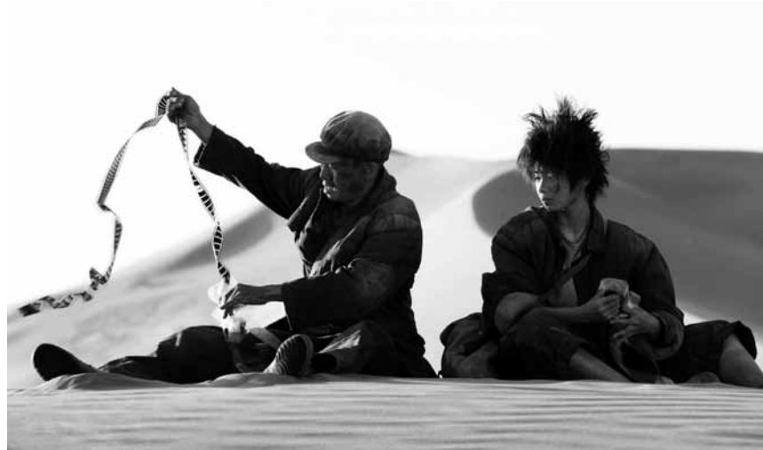
Eine Liebeserklärung an die Magie des analogen Films: „Yi Miao Zhong“ läuft neu im Utopia.

Géif d'Weltbevölkerung liewen, wéi en*g Duerchschnëttslëtzebuurger*in, wieren aacht Planéiten Äerd néideg, fir genuch Ressourcen ze liwweren. „Eng Äerd“ presentéiert laangfristeg Initiativen vu lëtzebuergeschen Bierger*innen, déi géint d'Erschöpfung vun Naturressourcen ukämpfen. Verschidde schonns existéierend Initiative gi vun dejéinige virgestallt, déi se virundreiwen a betreiben. E wéist, datt jiddereen* dozou