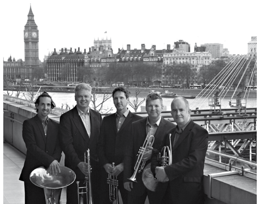
Britisches Flair in Marnach: Das London Brass Quintet ist am 10. Juni zu Gast im Cube 521 und hat Werke von Bach, Scarlatti und Carter im Gepäck. Ab 20 Uhr.

P.R2B , Electro-Synth Pop, Festivalclub Sektor Heimat, Saarbrücken (D) , 22h. Im Rahmen des Festival Perspectives. festival-perspectives.de