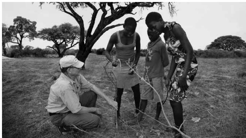
Bäume wachsen lassen, ohne welche zu pflanzen - wie das geht, zeigt Tony Rinaudo: „Der Waldmacher“. Neu im Kulturhuf Kino, Le Paris, Orion, Prabbeli, Scala, Starlight und Sura.