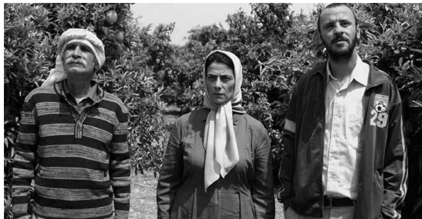
Ein Streit um Zitronenbäume als Parabel zum israelisch-palästinensischen Dauerkonflikt: „Etz Limon“ läuft an diesem Sonntag, dem 19. Juni, um 19:30 Uhr in der Cinémathèque.