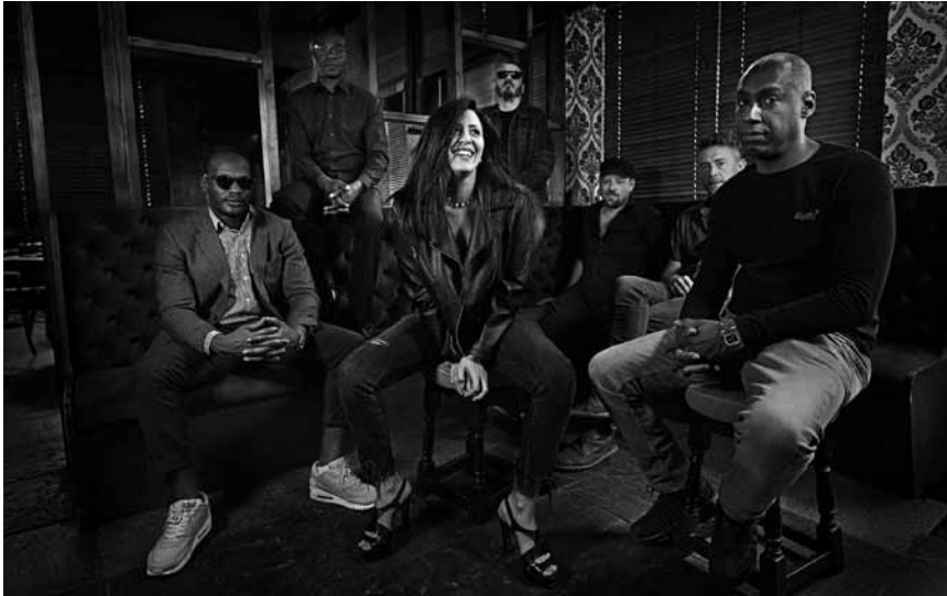
Le Amy Winehouse's Original Band rend hommage à l'artiste Amy Winehouse, décédée en 2011. À l'Artikuss de Soleuvre, le 1er juillet à 20h.