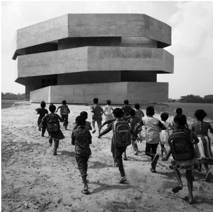
Le Luxembourg Center for Architecture présente des photographies d'Hélène Binet du 29 juin au 11 octobre, sous le titre « Faraway so Close ».

jusqu'au 3.7, me. - ve. 15h - 18h, sa. + di. 14h - 18h.