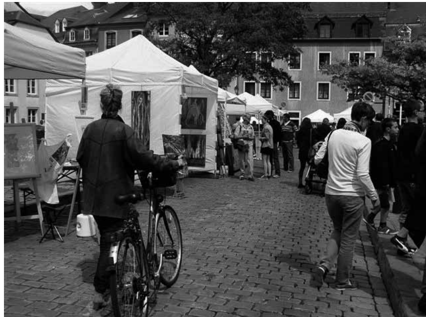
Le Grund à Luxembourg-ville se transforme en musée de plein air : « Konscht am Gronn » offre des expos et des concerts, ce dimanche 3 juillet, de 10h à 18h.