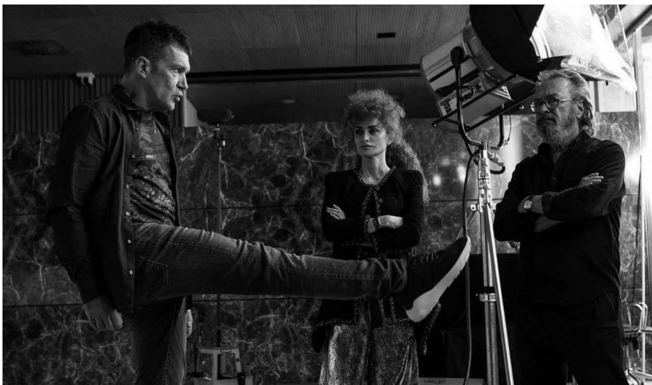
« Competencia oficial » est un film sur... le monde du film : que des stars sur le set, mais leur ego empêche le tournage ! Nouveau à l'Utopia.