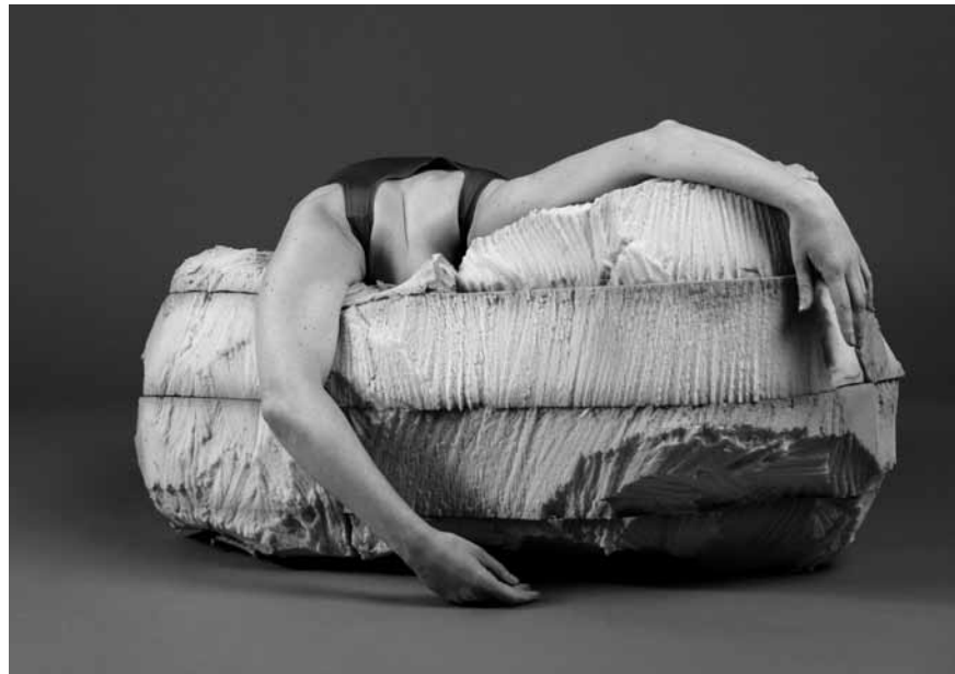
Diese Szene aus „Empire of a Faun Imaginary“ zeigt einen von vier verzweifelten Waldgeistern, deren Weltordnung unerwartet ins Wanken gerät.

Der Krieg in der Ukraine hat mich stark beeinflusst. Er begann in unserer ersten Probeweche; mein Ehemann ist ein russischer Regimegegner. Es ist desillusionierend zu beobachten, dass sich Geschichte wiederholt, statt sich zum Guten zu wenden. Ich war mit 16 Jahren zum ersten Mal in Russland und bin danach regelmäßig zurückgekehrt. Mein Ehemann und ich haben während meiner Studienzeit zwischen London und Moskau gelebt, kurz vor Ausbruch der Pandemie habe ich eine