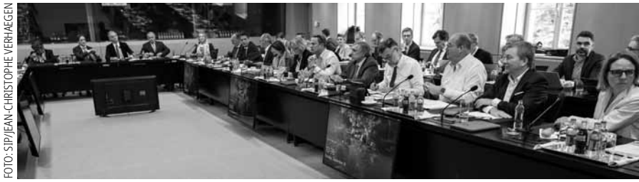
In Senningen würde es in der Quadripartite vielleicht etwas eng werden.