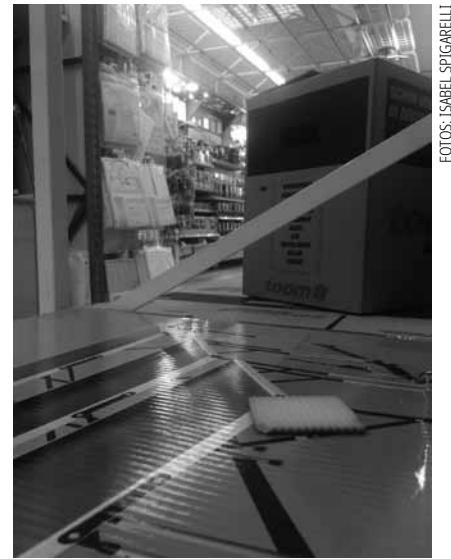
Der Keks machte den Anfang: Mit dieser Aufnahme aus dem Jahr 2016 begann mein zunächst privates Fotoprojekt „Alltagsabsurditäten“.

Im November 2021 habe ich auf der Rückseite der woxx ausgewählte Aufnahmen aus den Frankfurter Jahren unter dem Titel „Alltagsabsurditäten“ geteilt, jetzt sind ausschließlich Fotos aus Luxemburg an der Reihe. Eins vorneweg: Luxemburg hat bisher weniger zu bieten als Frankfurt. Liegt das daran, dass das eigene Geburtsland weniger Neugier weckt als eine fremde Stadt? Oder ist Luxemburgs öffentlicher Raum öde? Beides trifft zu, denke ich. Durch Großstädte wie Frankfurt geistern täglich Millionen kreativer Köpfe, hungrige Student*innen und Finanzhaie. Ein Großteil läuft zu Fuß durch die Nebengassen und Hauptstraßen, anders als in Luxemburg, wo viele in Blechkästen auf der Autobahn bis zur nächsten Ausfahrt anstehen. Auch ich bewege mich hierzulande weniger und halte mich seltener im öffentlichen Raum auf, als das in der Mainmetropole der Fall war. Wenn, dann lieber in