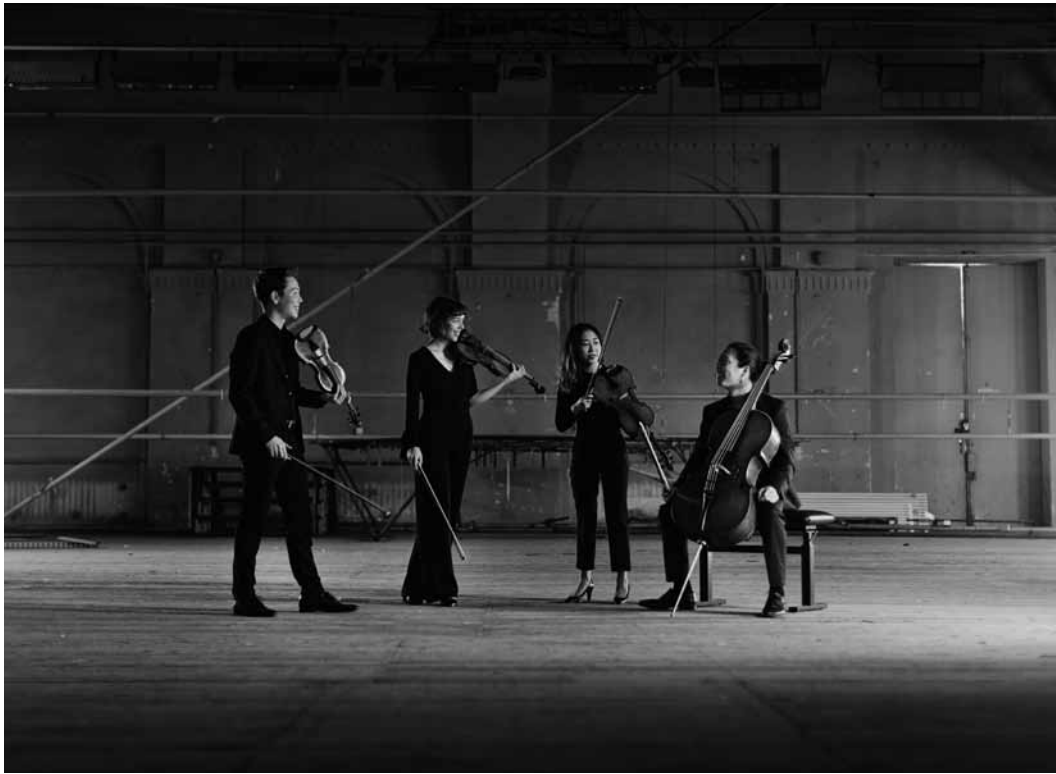
Le quatuor berlinois Leonkoro fera le grand écart de Beethoven à Webern le 7 décembre au Cape.