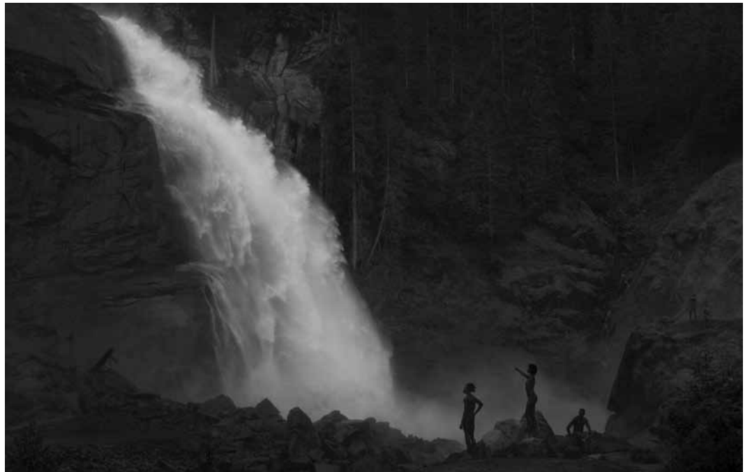
Das Musée national d'histoire et d'art in Luxemburg-Stadt stellt vom 16. Dezember bis zum 11. Juni von Edward Steichen inspirierte Fotografien von Erwin Olaf und Installationen von Hans Op de Beeck aus.

Programmation Zoom In : Exploration sensorielle , visite guidée