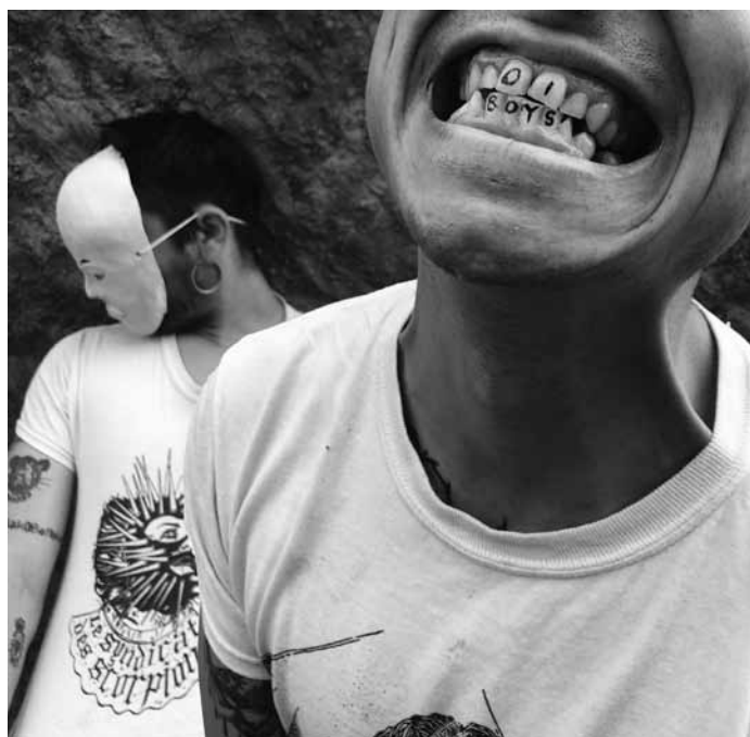
Oi Boys, Post-Punk Duo aus Metz, spielt am 15. Dezember, um 20 Uhr in den Rotondes in Luxemburg-Stadt – mit Support von Lawn Chair.