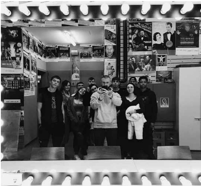
Der Jugendtreff Norden präsentiert sein Stück „Hope“ – der Titel ist Programm –, am 17. Dezember um 20 Uhr im Cube 521 in Marnach.

Luxembourg, 15h30. Tel. 26 32 26 32. www.philharmonie.lu