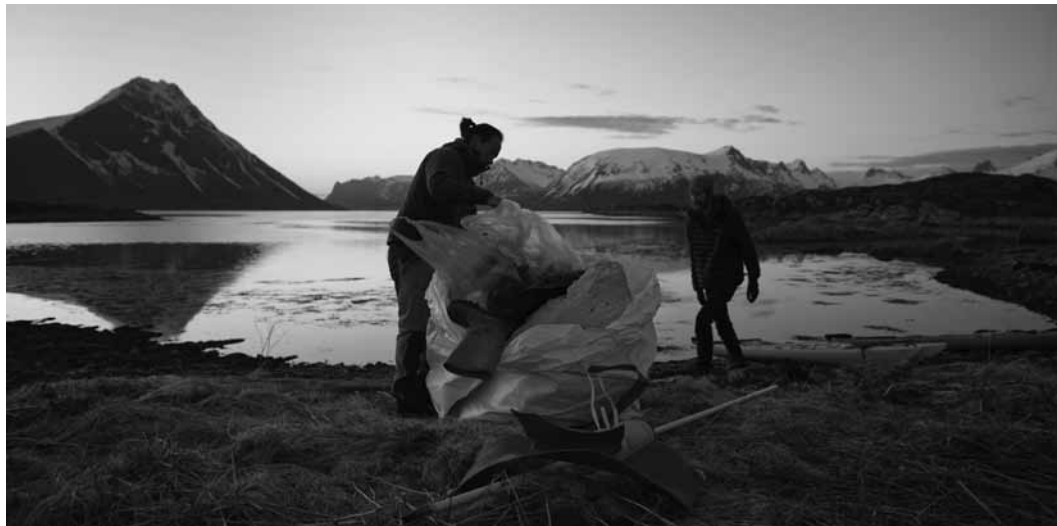
„The North Drift – Plastik in Strömen“, eine Doku über Plastikverschmutzung läuft ab jetzt in den regionalen Kinos.

Chiyoko Fujiwara, ancienne gloire du cinéma japonais, vit recluse chez elle. Un journaliste, fervent admirateur, vient l'interviewer sur son passé et lui