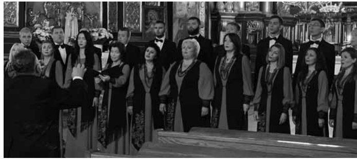
Es weihnachtet sehr im Cube 521 in Marnach: Am 23. Dezember, um 20 Uhr, ist der K&K Opernchor zu Gast.