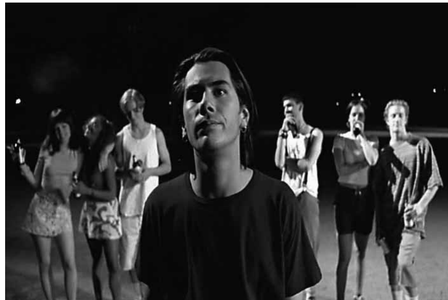
Der Cast von „Nowhere“ ist unübersichtlich groß – zumindest so lange, bis das Alien einige von ihnen entführt.

gleich gefilmt, die Teenager stehen im Kreis und werden reihum gefilmt, wie sie die Tablette schlucken. Auch der digitale Camcorder ist wieder Teil des Geschehens und wieder – wenn auch viel weniger – sind seine Bilder im Endprodukt zu sehen. Interessanterweise wird diese Ecstasy-Szene in TFU als Camcorder-Material gezeigt.