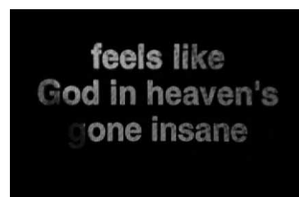
Mit Zwischentiteln kommentiert und rahmt Araki den ersten Teil der Trilogie ein.