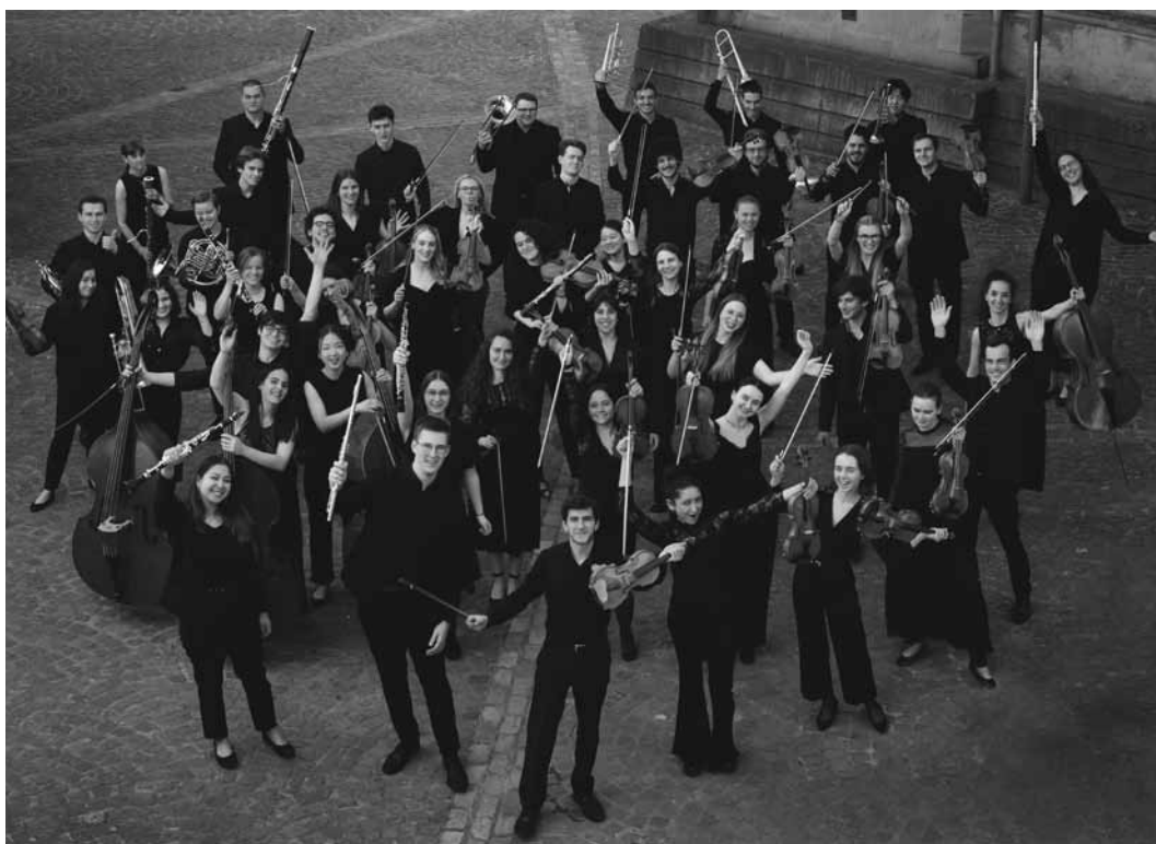
L'Orchestre national des jeunes du Luxembourg accompagnera le pianiste Hyung-ki Joo, sous la direction de Pit Brosius, ce vendredi 14 avril à 20h au Mierscher Kulturhaus.

Orchestre national des jeunes du Luxembourg , sous la direction de Pit Brosius, avec Hyung-ki Joo (piano), œuvres entre autres de Ravel, Joo