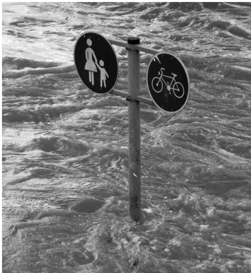
Scénarios extrêmes : la mobilité douce contribue à réduire le risque, mais ne l'annule pas.

(1m) – Rester en dessous de 1,5 degré – mais si, c'est possible ! Des scénarios qui maintiennent le réchauffement sous ce seuil, considéré comme tolérable, sont évoqués dans le récent rapport de synthèse de l'IPCC. Rassurant donc, à condition de zapper le texte entre parenthèses, qui indique que cette limitation de température est maintenue avec une probabilité... d'au moins 50 pour cent. Autrement dit : même dans les scénarios « optimistes », on a un gros risque de dépasser 1,5 degré et d'en souffrir les conséquences. Les méthodes de la climatologie sont rigoureuses, mais elle n'est pas une « science exacte », ce qui explique les nombreuses indications de probabilités dans les publications scientifiques. Un autre constat rassurant du rapport doit également être relativisé : grâce aux limitations des émissions de la décennie passée, la probabilité de scénarios extrêmes a baissé. Le constat comporte en effet une note de bas de page expliquant qu'un réchauffement de plus de 4 degrés « peut également résulter de scénarios à émissions limitées, si la sensibilité du climat ou les rétroactions du cycle carbone sont plus élevées que les estimations actuelles ». Les incertitudes de la climatologie justifieraient donc de redoubler d'efforts, mais aussi d'accorder plus d'attention aux scénarios catastrophes (woxx 1715).