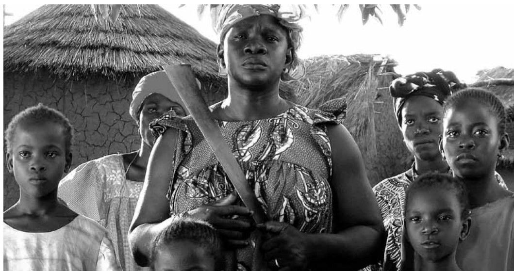
« Moolaadé » est un film sénégalais sur les mutilations génitales féminines et le droit à la protection. À voir le jeudi 20 avril à 19h à la Cinémathèque.

Dans un village sénégalais, Collé Ardo n'accepte pas que son unique fille soit excisée. La nouvelle se répand dans le pays, et quatre fillettes lui réclament