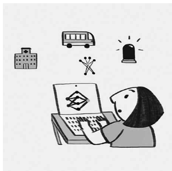
ILLUSTRATION: YASMIN DWIPUTRI & DATA HAZARDS PROJECT / BETTER IMAGES OF AI / AI ACROSS INDUSTRIES / CC-BY 4.0

KIs könnten in verschiedensten Bereichen für Probleme sorgen, wenn sie nicht reguliert werden.