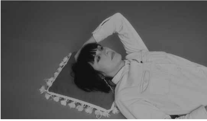
La musicienne grecque Stella jouera de l'indie pop aux Rotondes, le 25 mai à 20h.