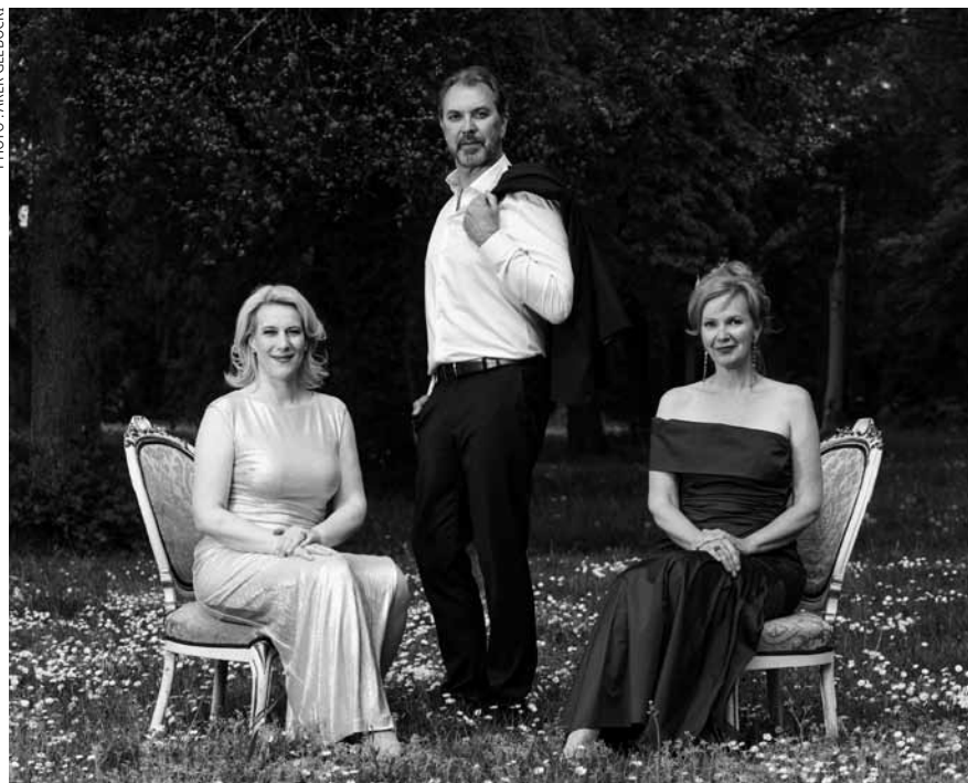
Le trio Cénacle continue son exploration pluridisciplinaire des écrits de Victor Hugo avec un CD...