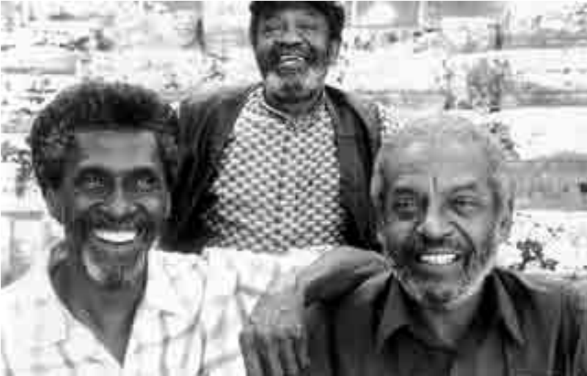
The Holmes Brothers sind am Samstag, den 24. November zu Gast im Sang a Klang in Luxemburg-Pfaffenthal. Org.: Folk Clupp Lëtzebuerg.

Gimps und Gurken , zwei Hörspiele und ein Radio-Feature von Antje Vowinckel, TUFA, Trier, 11h . Infos und Karten über Tel. 0049 651 7 18 24 12.