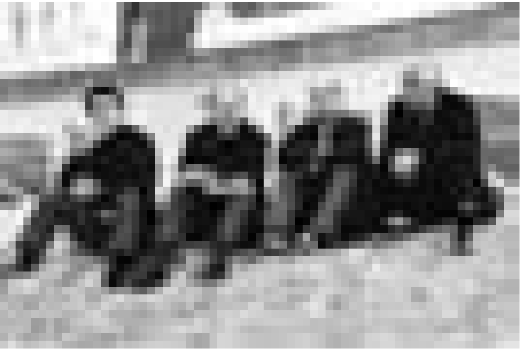
Quatre amis sont au tournant de leur vie d'adulte ... Marc Lavoine, Jean-Pierre Darroussin, Bernard Campon et Gérard Darmon dans "Le coeur des hommes" de Marc Esposito. Nouveau à l'Utopia.