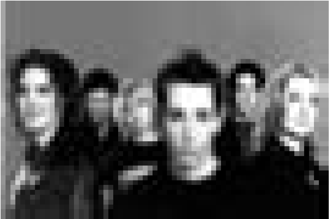
Krezip - Power Rock. Le samedi 26 juillet lors du "Alive Festival 2003" à St-Vith.