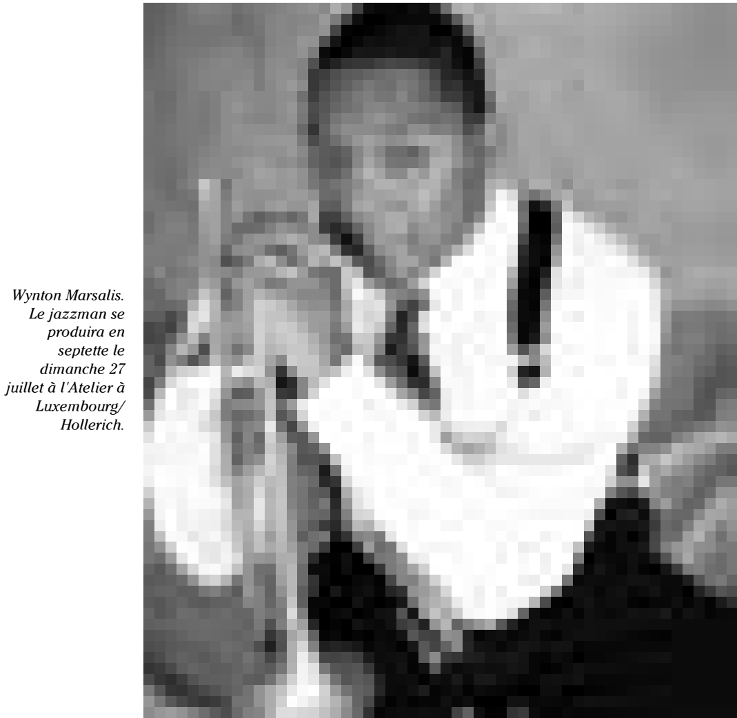
Wynton Marsalis. Le jazzman se produira en septette le dimanche 27 juillet à l'Atelier à Luxembourg/ Hollerich.

Something about love , visite guidée régulière de l'exposition,