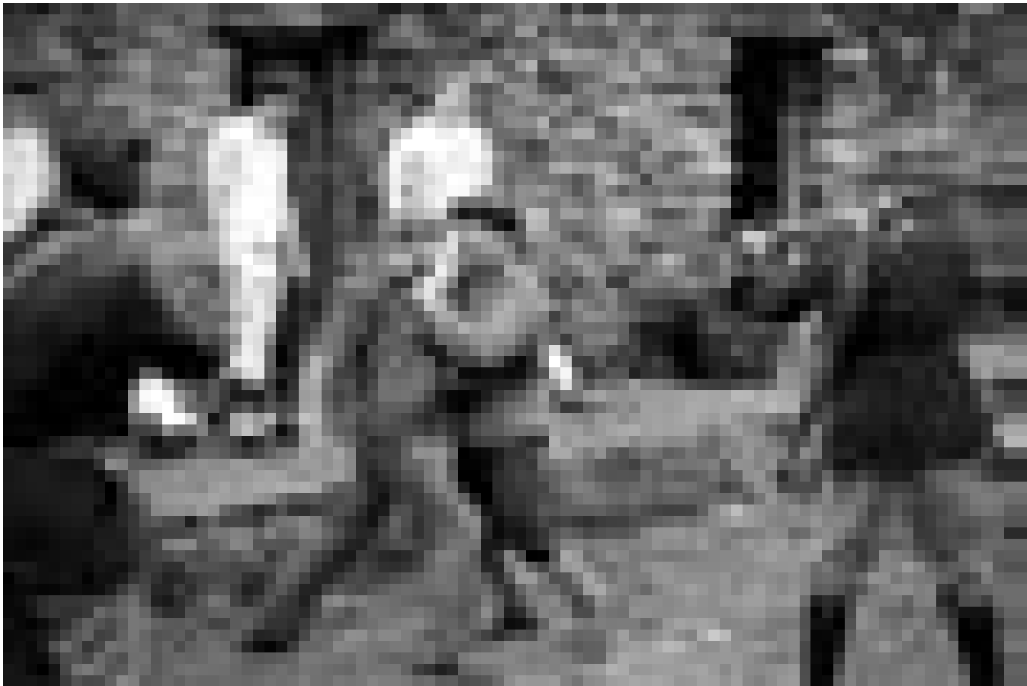
Depuis le XIIIe siècle les Irlandais se battent pour leur indépendance ... Le film "The Wind that shakes the Barley" de Ken Loach a reçu la d'Palme d'Or 2006. En avant-première à l'Utopia.