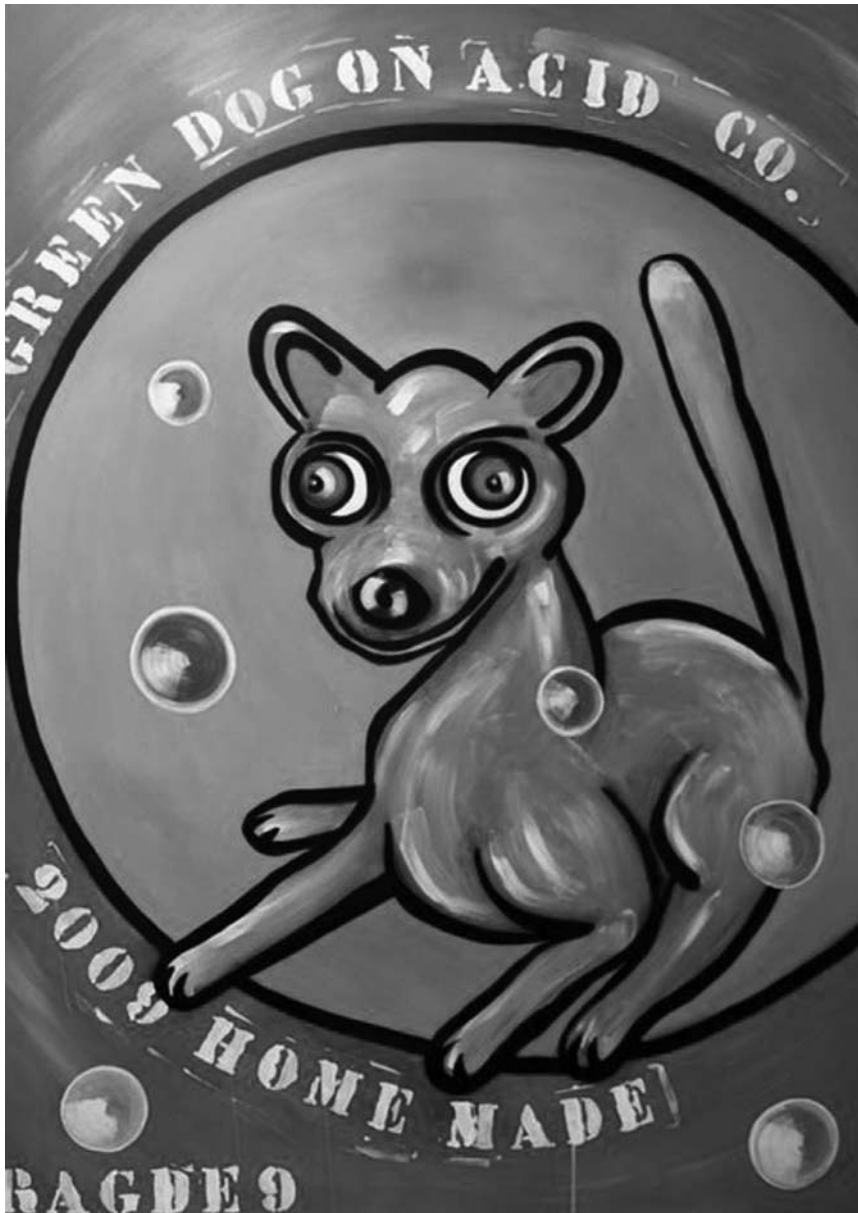
Bis zum 17. August stellt Edgar Kohn seine farbenfrohen Bilder im Kjub in Luxemburg aus.