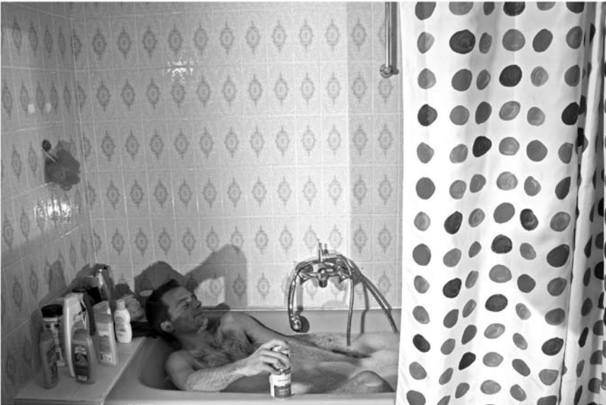
Les photographies de Vangelis Anthimos resteront accrochées au Tunnel menant à l'ascenseur reliant le Grund à la Ville haute jusqu'au 28 juin.

peintures, Galerie d'Art Schortgen (24, rue Beaumont, tél. 26 20 15 10), jusqu'au 9.7, ma. - sa. 10h30 - 12h30 + 13h30 - 18h.