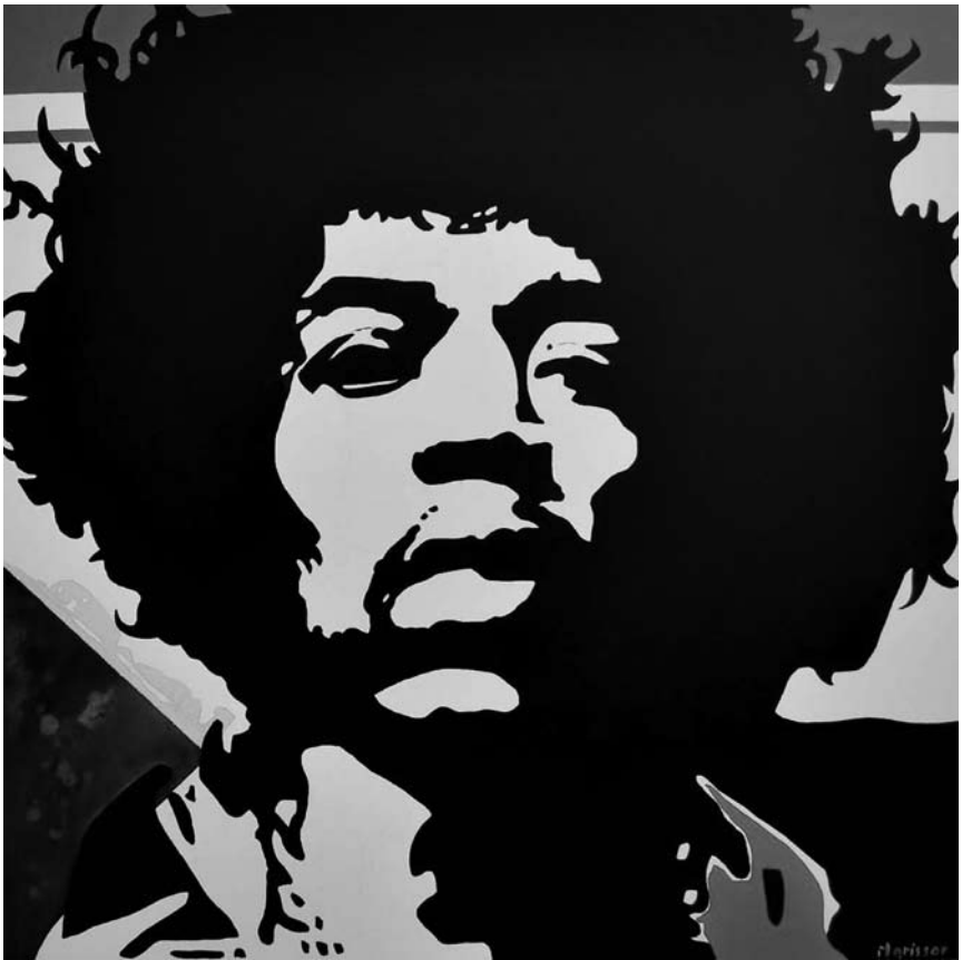
Les portraits de fer de Morisson sont exposés à la Brasserie de Paris à Mondorf jusqu'au 25 juillet.