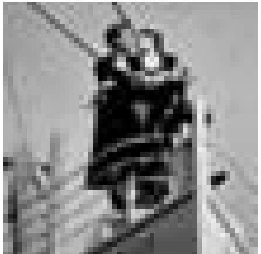
Une folle histoire d'amour et une grande catastrophe. Leonardo DiCaprio et Kate Winslet dans « Titanic », dimanche à la Cinémathèque.

☒☒☒ Une expérience réussie qui montre que les nouveaux conflits au Proche-Orient commencent à s'enraciner dans la conscience américaine. (lc)