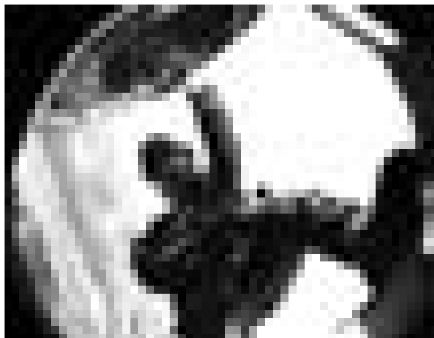
Israelische Soldaten in einer tödlichen Falle ... „Lebanon“ von Samuel Maoz. Neu im Utopia.