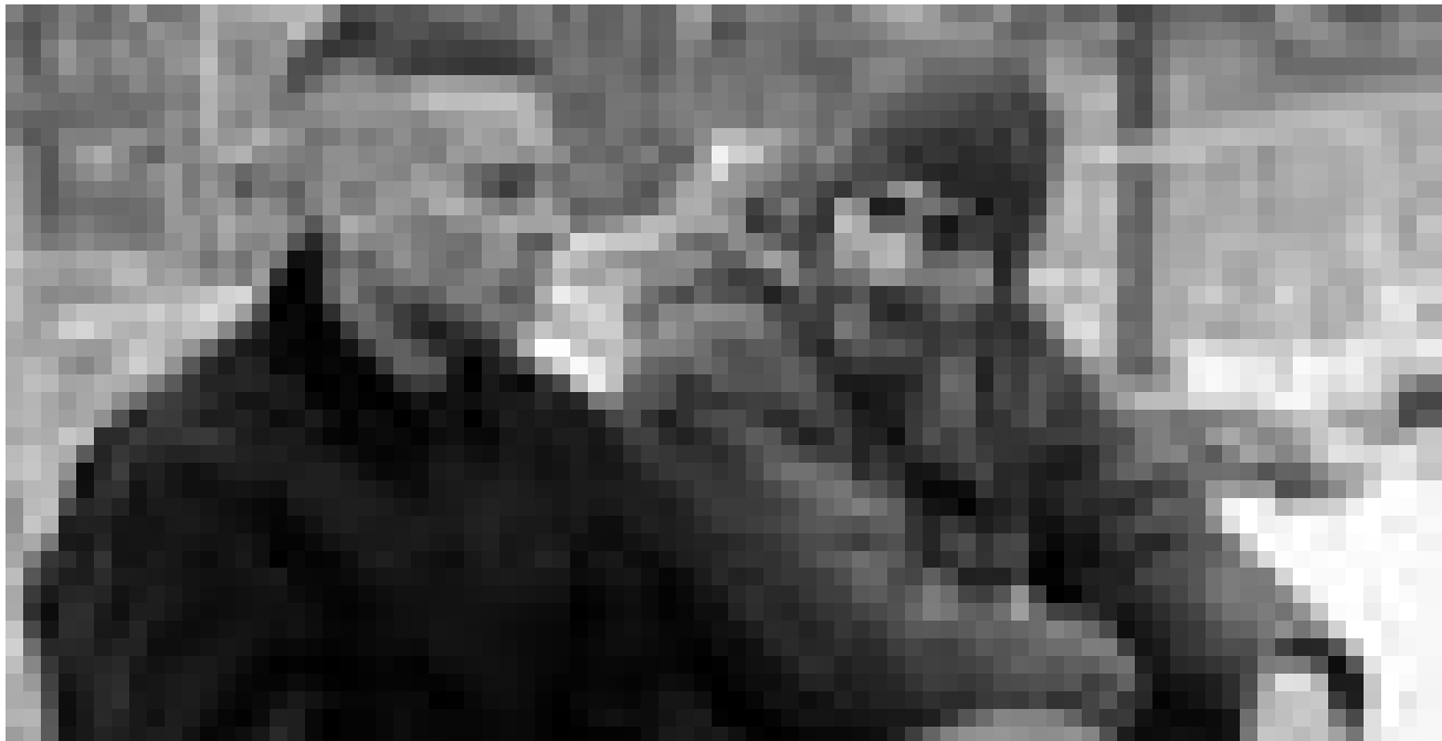
Zwei Brüder die die gleiche Frau lieben. Tobey Maguire und Jake Gyllenhaal in „Brothers“. Neu im Utopolis, Starlight und CinéBelval.

vor 120.000 Zuschauern und wirbt für die Versöhnung der schwarzen und weißen Bevölkerung Südafrikas. 1994 wird er zum Präsidenten gewählt. Um der Bevölkerung das Gefühl von Gemeinschaft zu geben, sorgt er dafür, dass das nationale Rugbyteam an der Weltmeisterschaft teilnimmt.