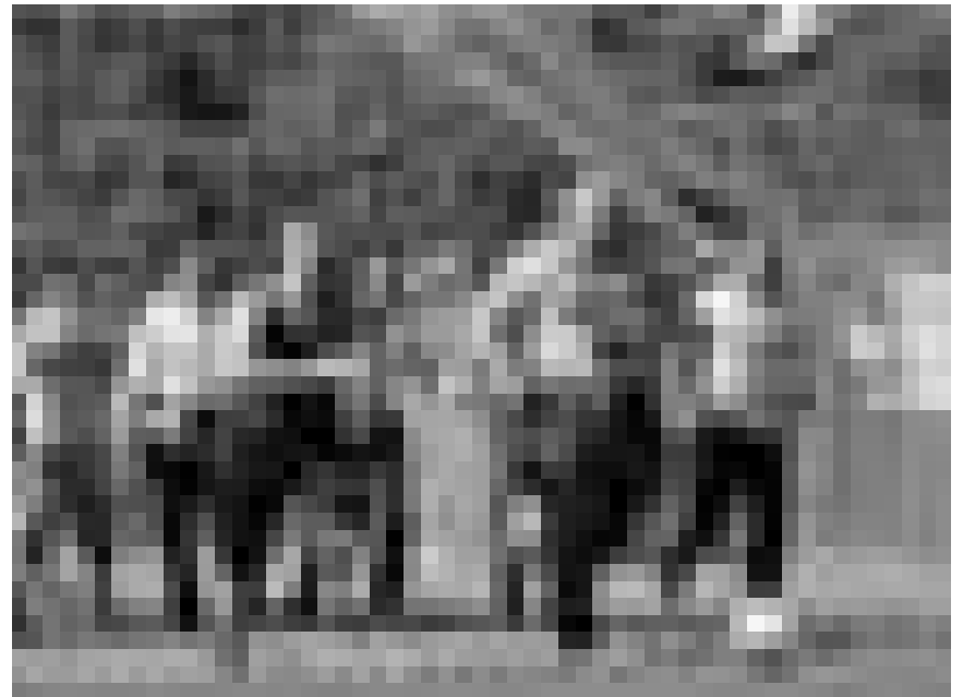
Fußball verbindet: Im Rahmen des „Panorama du Film Polonais“, zeigt das Kinosch am Montag die Komödie „The Offsiders“.

Als die 19-jährige Alice einen Heiratsantrag vom wohlhabenden, aber langweiligen Hamish erhält, flieht sie. Sie folgt einem mit einer Weste beklei-