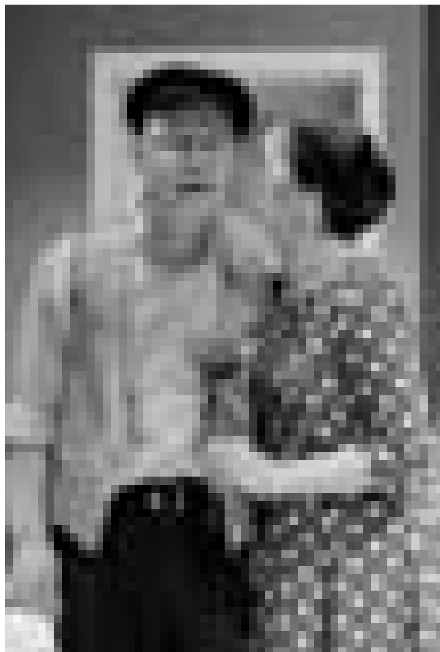
Nebenan, gehts auch ab ... „Nebenan“, Gastspiel des Berliner Grips Theaters, im Marnacher Cube 521, am 22. März.

Matinée mit Frühstück zu „Sakontala“ , Saarländisches Staatstheater, Saarbrücken , 11h. Tél. 0049 681 30 92-0.