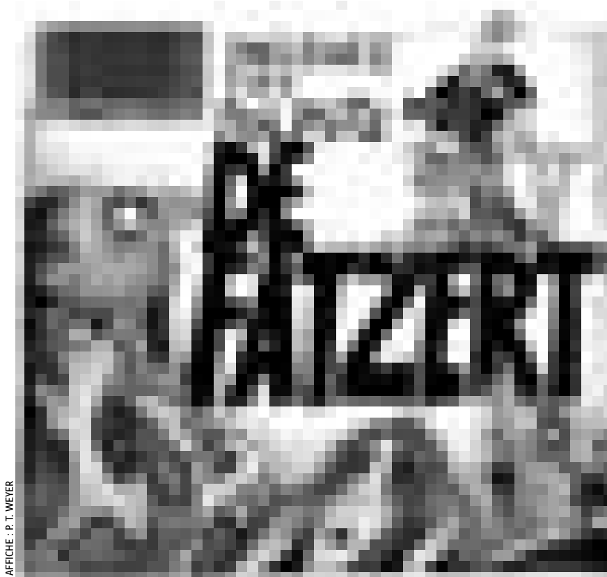
AFFICHE: P. T. WEYER

Les Salonnards , Kulturhaus, Niederanven , 20h. Tél. 26 34 73-1.