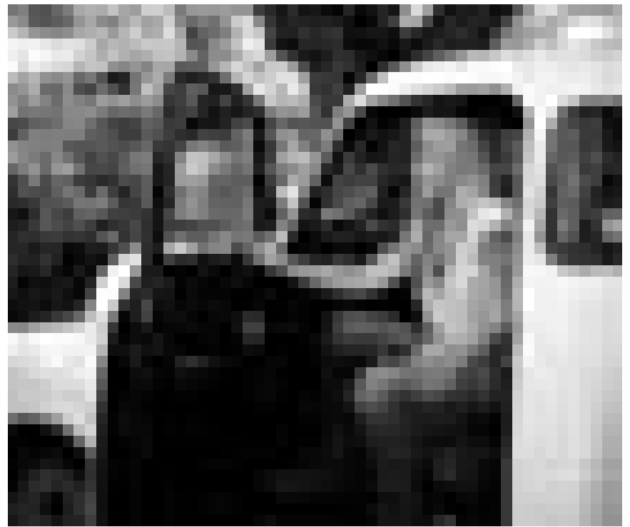
Die große Lady des Blues und Folk kommt nach Luxemburg : Rickie Lee Jones, an diesem Freitag im Atelier.