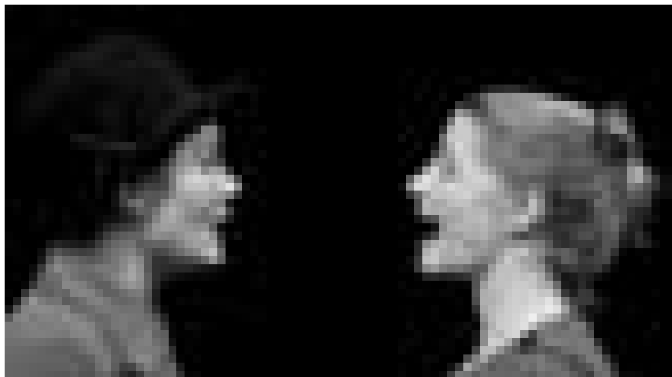
Kommunikation ist mehr als bloßes miteinander reden : In « Café Welt » wird die Sprache auf eine harte Probe gestellt. Am 23. März im Merscher Kulturhaus.

The Vianden Retrospective (5/5) , projection de trois documentaires, Café Ancien Cinéma, Vianden, 19h. Tel. 26 87 45 32.