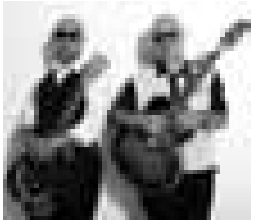
Auch im Sommer kann man den Blues bekommen : Blues Company Unplugged, am 11. und am 12. Juni in der Brasserie L'Inouï in Redingen.