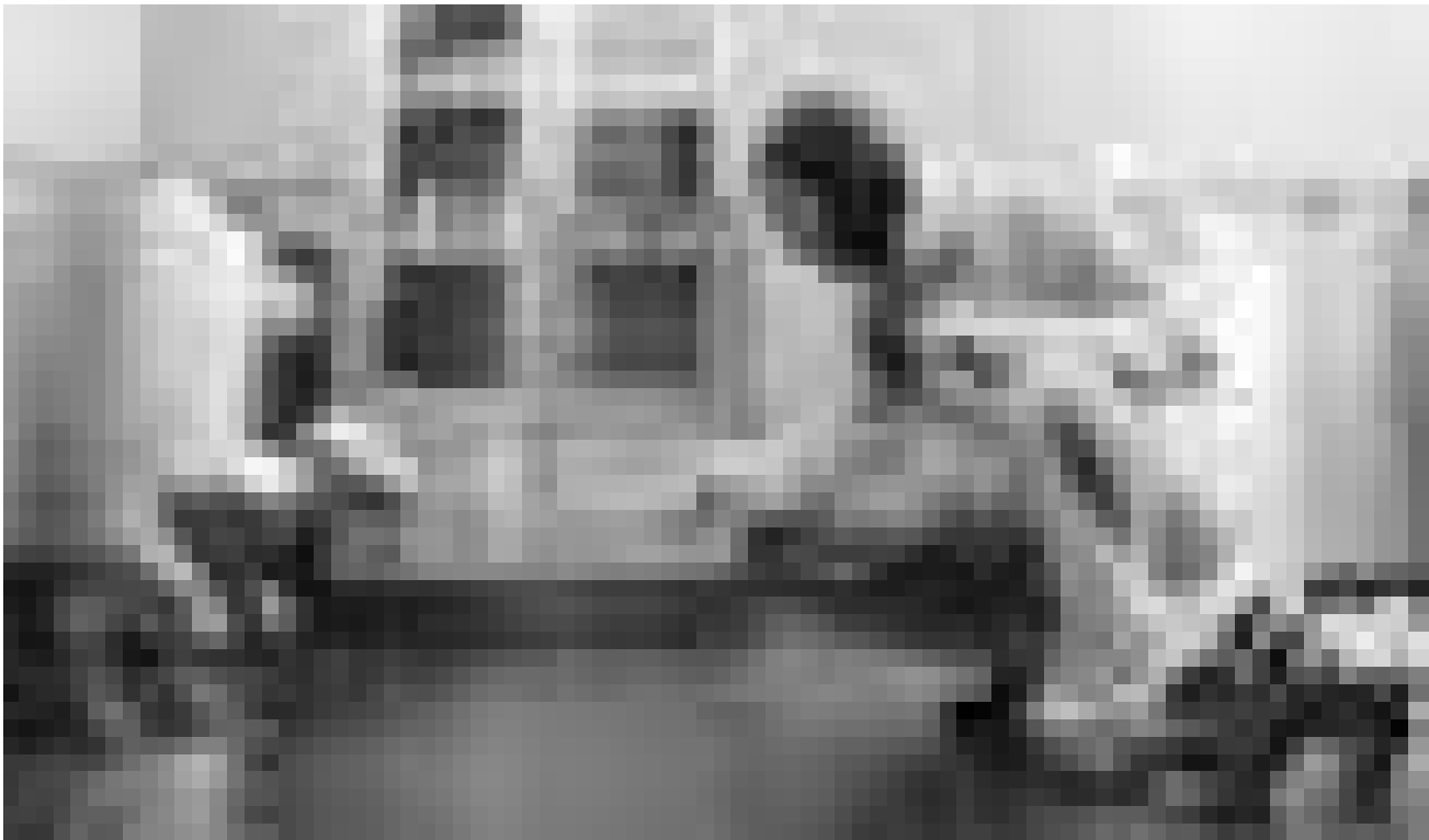
Coucou, petite créature maléfique...