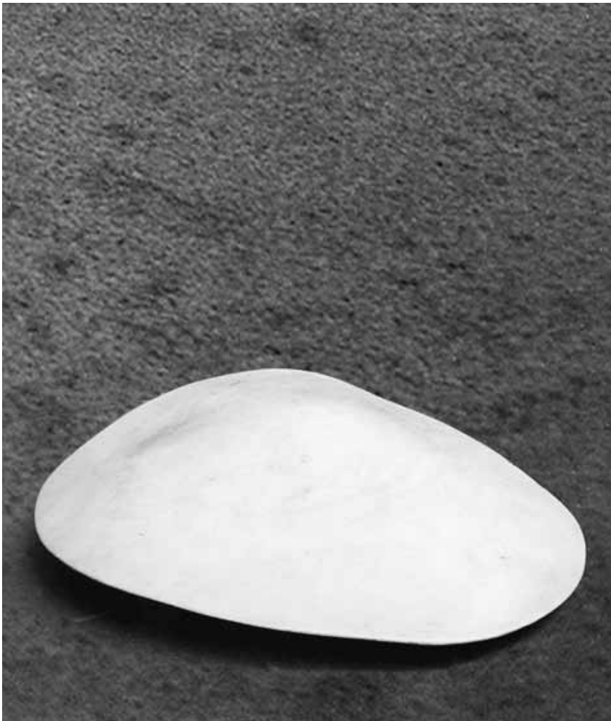
Keine Qualle am Strand, sondern eine der Skulpturen von Leo Kornbrust. Zu sehen im Espace Médiart bis zum 5. Mai.