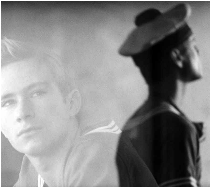
Mururoa, les essais nucléaires, les irradiations, le film de Marion Hänsel tombe au moment opportun : « Noir Océan », nouveau au Kinosch.