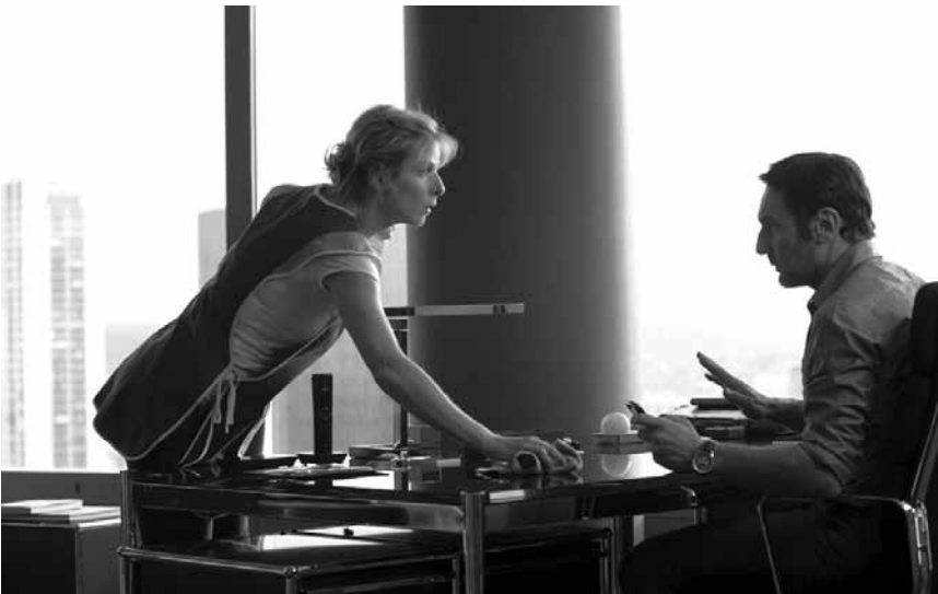
La femme de ménage en sait un peu plus qu'il ne croit : « Ma part du gâteau », le nouveau film de Cédric Klapisch, à l'Utopia.

USA 2010 von Darren Aronofsky. Mit Natalie Portman, Mila Kunis und Vincent Cassel. 103'. O.-Ton, fr. + nl. Ut. Ab 12.