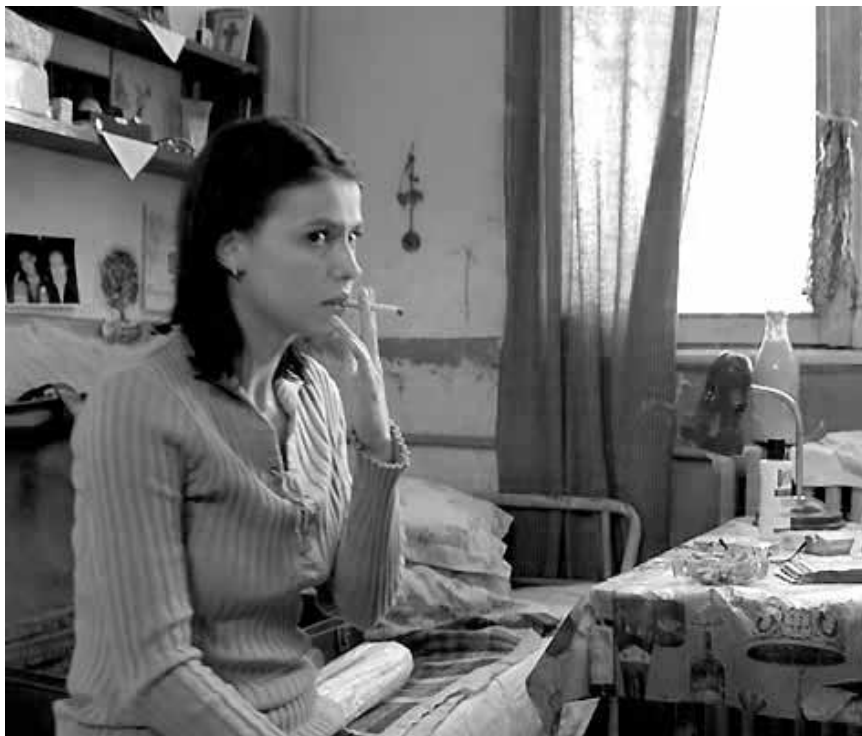
Abtreiben in Ceaușescus wunderlicher Diktatur war nur illegal möglich: „4 Luni, 3 Saptamini Si 2 Zile“, am Montag in der Cinémathèque.