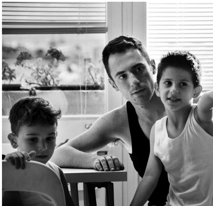
Sur la longue pente descendante vers la précarité... « La Nostra Vita », lundi à l'Utopia, dans le cadre de « Film and Popular Culture ».

Türkei September 1955, Wohnungen und Läden von Nicht-Muslimen werden von einem aufgebrachten Mob verwüstet und geplündert. In Istanbul, befindet sich der Jurastudent Behcet