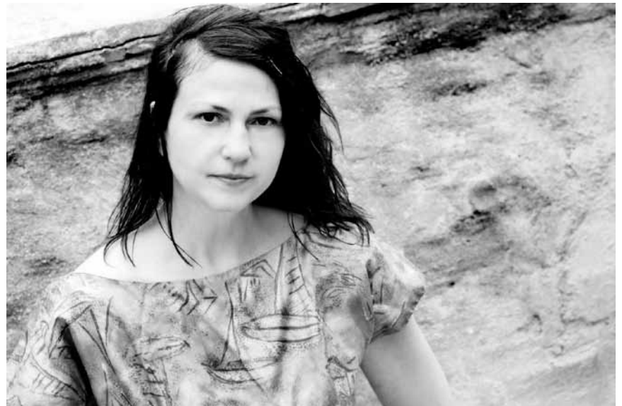
Lisa Germano est sûrement une des pionnières du singer-songwriting féminin. Elle fera une petite virée par les Aralunaires à Arlon ce dimanche 1er mai, à l'ancien Palais de Justice.