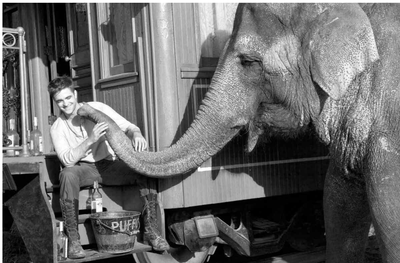
Vom Vampir zum Clown : Robert Pattinson in „Water for Elephants“, neu im Utopolis und im CinéBelval.