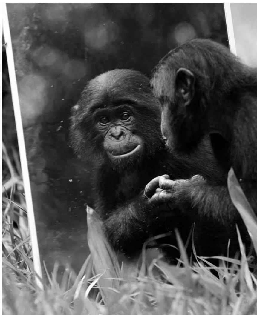
Bons et beaux les bonobos : pour celles et ceux qui veulent en avoir la preuve, allez voir « Bonobo », nouveau à l'Utopia.