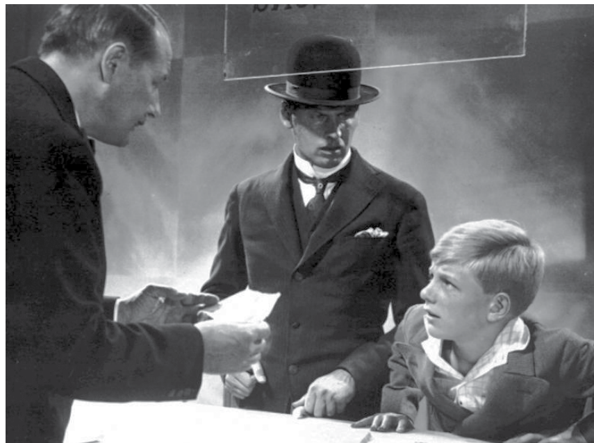
Emil muss selbst herausfinden, wer ihm sein Geld geklaut hat. „Emil und die Detektive“, nach Erich Kästner, am Sonntag in der Cinémathèque.

Irina Dubrovna, jeune modéliste, se croit la descendante d'une race de femmes qui se transforment en panthères quand elles perdent leur virginité. Hanté par cet héritage, Irena mène une vie chaste et solitaire. Un jour, un jeune architecte naval, Oliver, tombe amoureux d'elle.