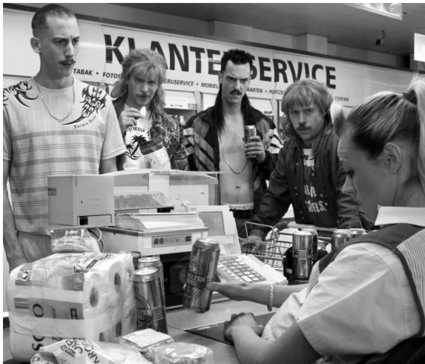
Nie mehr bezahlen... Ob das wohl auf Dauer gut geht? - „New Kids Turbo“, neu im Utopia.

Derweil bereitet das verschlagene Kükén Carlos einen Putsch auf die Schokoladenfabrik der langohrigen Unternehmer vor.