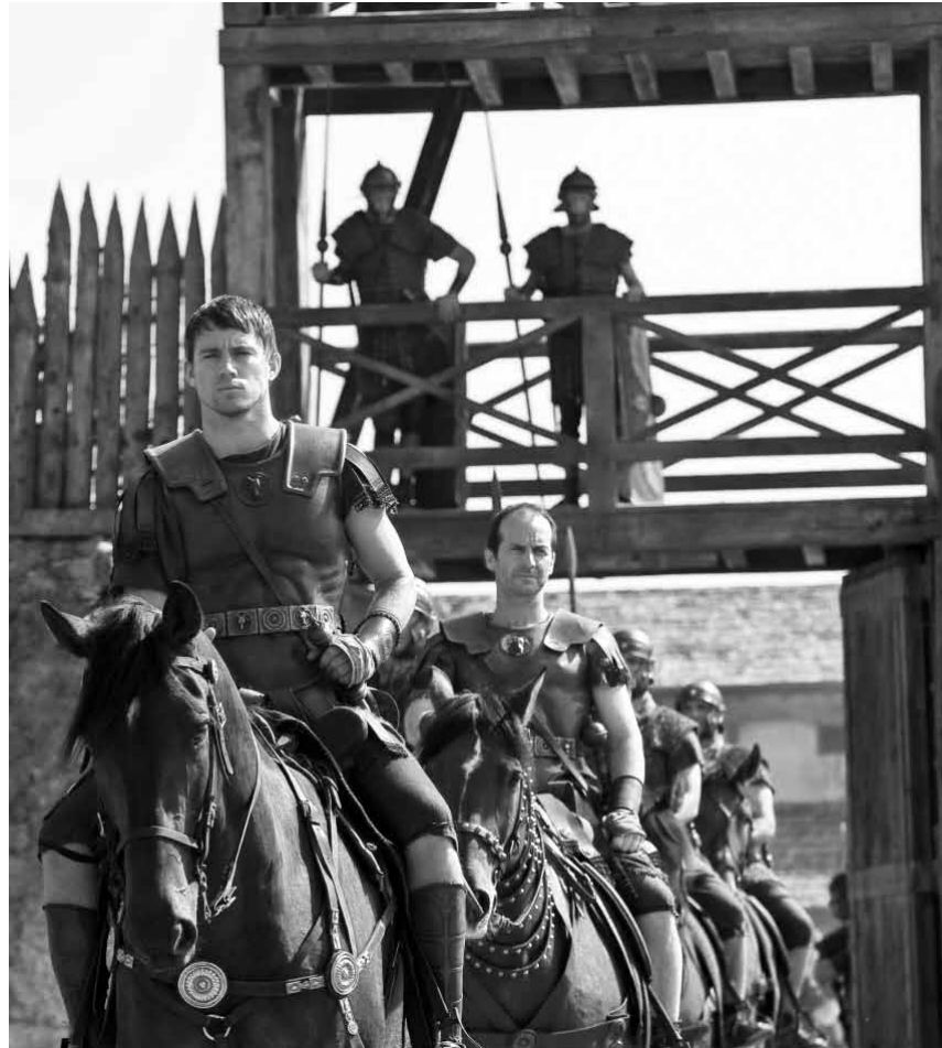
Auch die Römer wollten mal die Welt zivilisieren: „The Eagle“, neu im Utopolis, CinéBelval und Ciné Starlight.

Patricia attend un enfant de Jacques, qui est pilote de chasse et doit partir au front. Les riches parents de Jacques crieront au chantage et Patricia et son père, le puisatier, auront seuls la joie d'accueillir l'enfant. Une joie que les grands parents du côté paternel leur envieront bientôt et chercheront à partager, car Jacques est porté disparu.