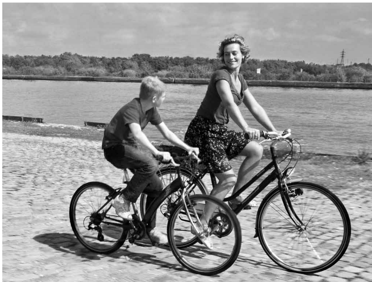
Le nouveau film des frères Dardenne se veut plus intimiste et il paraît que cela lui réussit: « Le gamin au vélo », nouveau à l'Utopia.

USA 2011 von Rob Marshall. Mit Johnny Depp, Penelope Cruz und Geoffrey Rush. 141'. Ab 12.