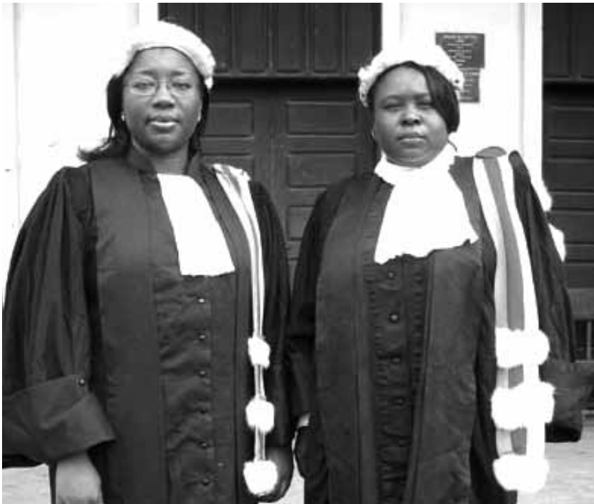
La dure réalité de la société africaine où les viols et les meurtres sont au quotidien est au centre de « Sisters in Law » - dans le cadre de « EcranApart », ce mardi à l'Utopia.

Inception USA/GB 2010 von Christopher Nolan. Mit Leonardo DiCaprio, Ken Watanabe und Marion Cotillard. 142'. O.-Ton, fr. + nl. Ut. Ab 12. Film and Popular Culture.