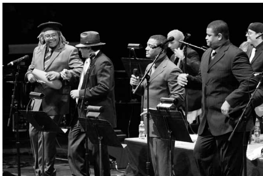
Les Afro-Cuban All Stars enchanteront leurs fans à l'Atelier le 25 mai.

Einfach anrufen, am Montag zwischen 9 und 12 Uhr. Tel. 29 79 99-0.