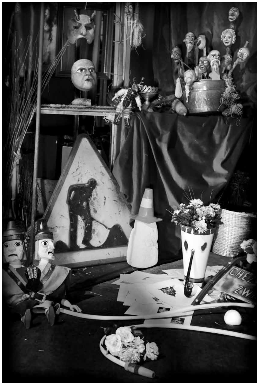
« En vous tant d'autre » - spectacle de marionnettes certes jeune public, mais pas dénué de profondeurs philosophiques. Les 23, 24 et 25 mai au Mierscher Kulturhaus.