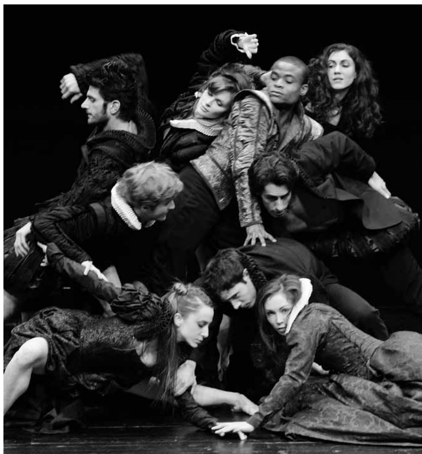
Mehr als nur Tanz: Eine richtige Multimedia-Performance ist Christian Spucks „Poppea/Poppea“ - basierend auf Monteverdis Oper „L'incoronazione di Poppea“. Am 20. Mai im Grand Théâtre.