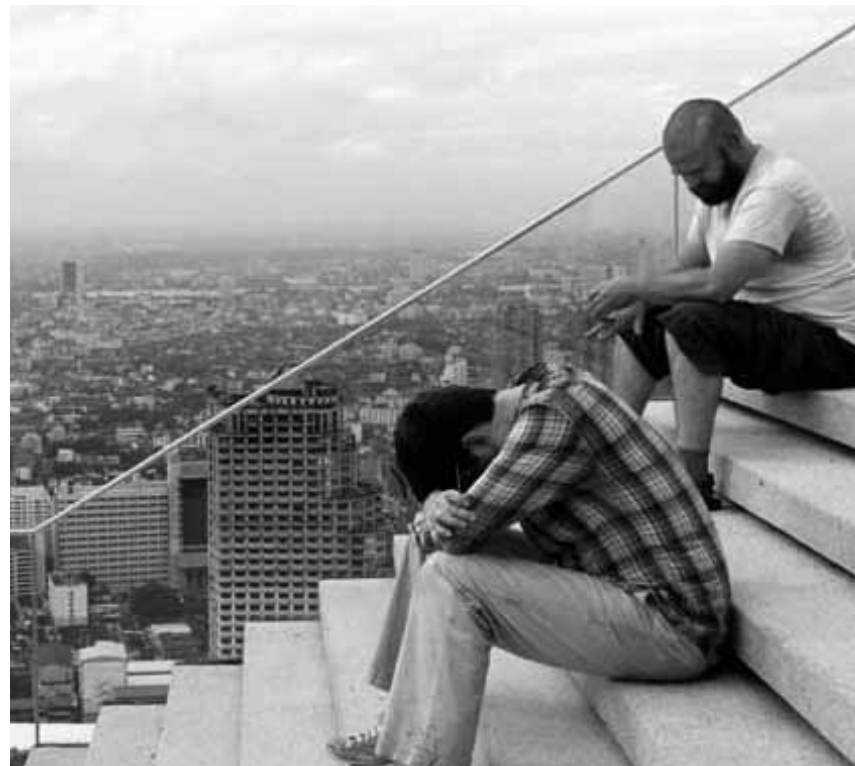
Verzecht in Bangkok, neben Kopfschmerzen tauchen nun auch noch Kommunikations-schwierigkeiten auf: „The Hangover 2“, neu Utopolis und im CinéBelval.