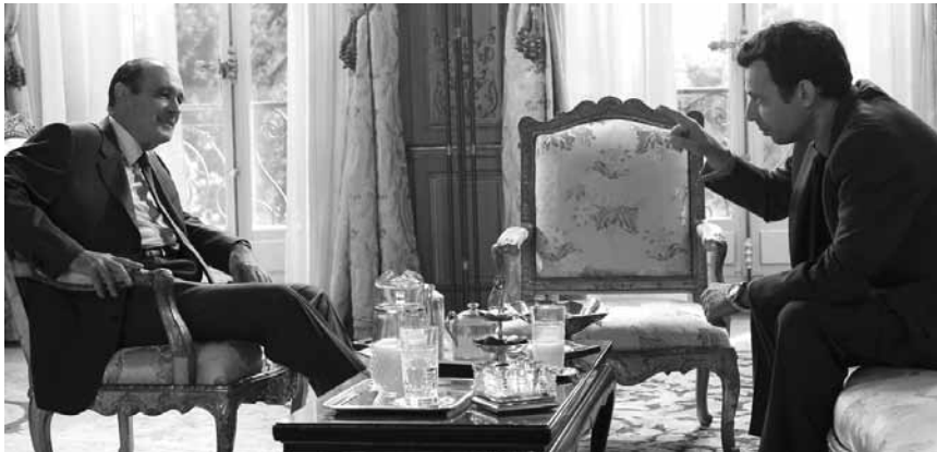
Ainsi va la République: tête-à-tête entre une vieille canaille et une petite racaille.