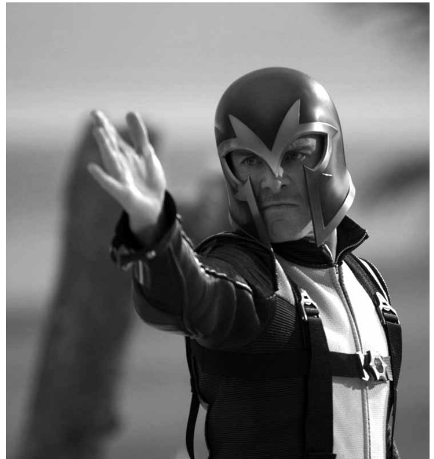
Nach den Sequels, nun das Prequel: „X-Men First Class“ - das Debüt der Mutantentruppe ist im Utopolis und im Ariston zu sehen.

Wer sagt denn dass Pandas träge sind? - „Kung Fu Panda 2: The Kabbom of Doom“ beweist das Gegenteil. Vorpremieren gibt's im Ariston und im CinéBelval.