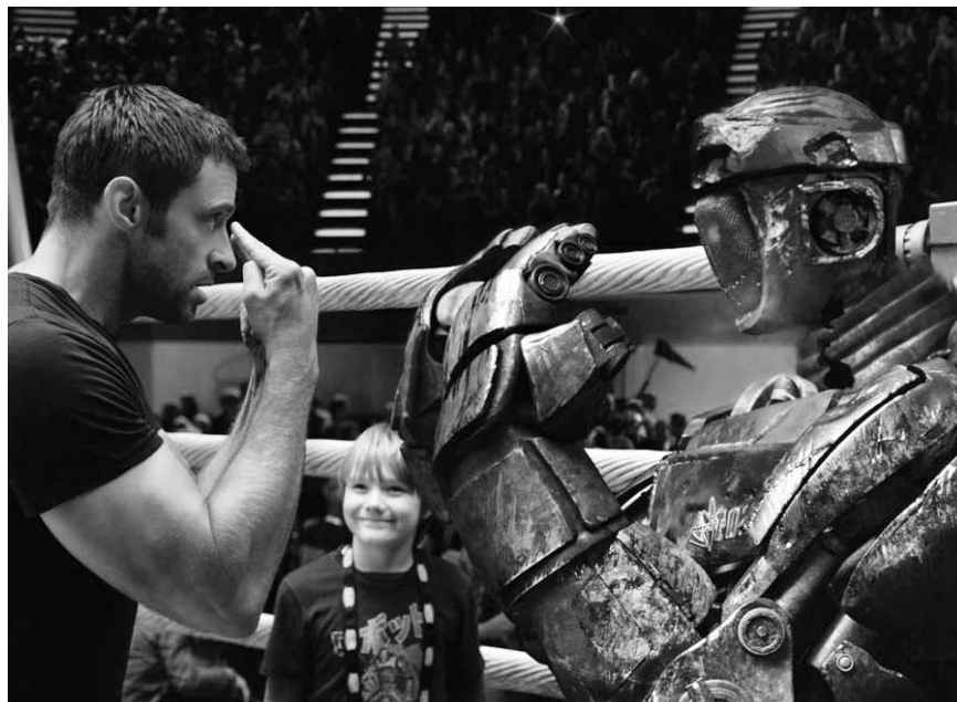
Ob er auch weiss wie man das Ding abschaltet? Hugh Jackman trainiert Kampfroboter in „Real Steel“, „Buddie's Night“ am Montag im CinéBelval.