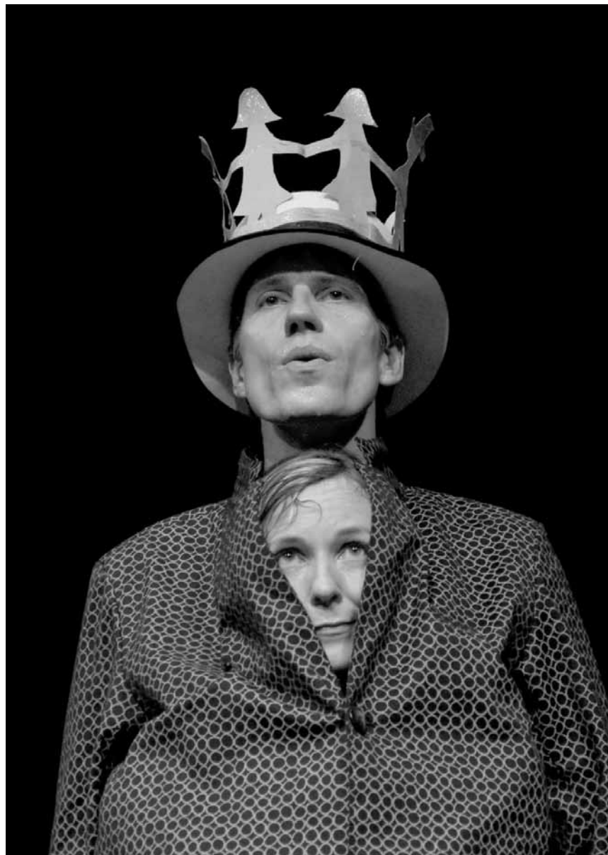
Wieder im Carré Rotondes, doch ohne Weihnachtstrara: „Anziehsachen“, am 26., 27. und am 28. Dezember.

The King and I , Musical von Richard Rodgers und Oscar Hammerstein, Theater, Trier (D), 19h. Tel. 0049 651 7 18 18 18.