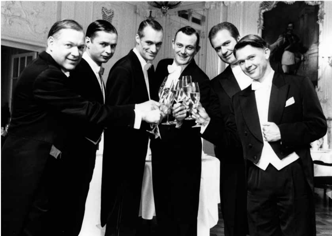
Das beste Krisenprodukt seit über 80 Jahren: Die „Berlin Comedian Harmonists“.