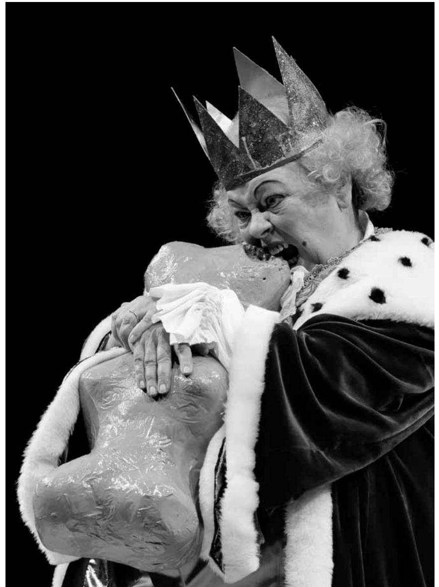
Der ehemalige SZ-Redakteur und Buchautor Axel Hacke hat bereits 1997 mit seinem Kinderstück „Der kleine König Dezember“ einen Klassiker erschaffen. Zu sehen am 26. Dezember im Carré Rotondes.