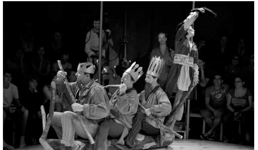
Und weiter geht's im royalen Theater- und Weihnachtsprogramm mit „Der König ohne Reich“, am 27. Dezember auch im Carré Rotondes.

Un livre illustré , atelier pour enfants de six à douze ans, Musée National d'Histoire et d'Art, Luxembourg , 14h30. Tél. 47 93 30-214.