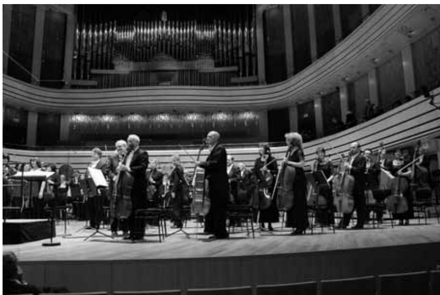
Spielen Liszt und Jongen: Die Deutsche Radiophilharmonie Saarbrücken Kaiserslautern.