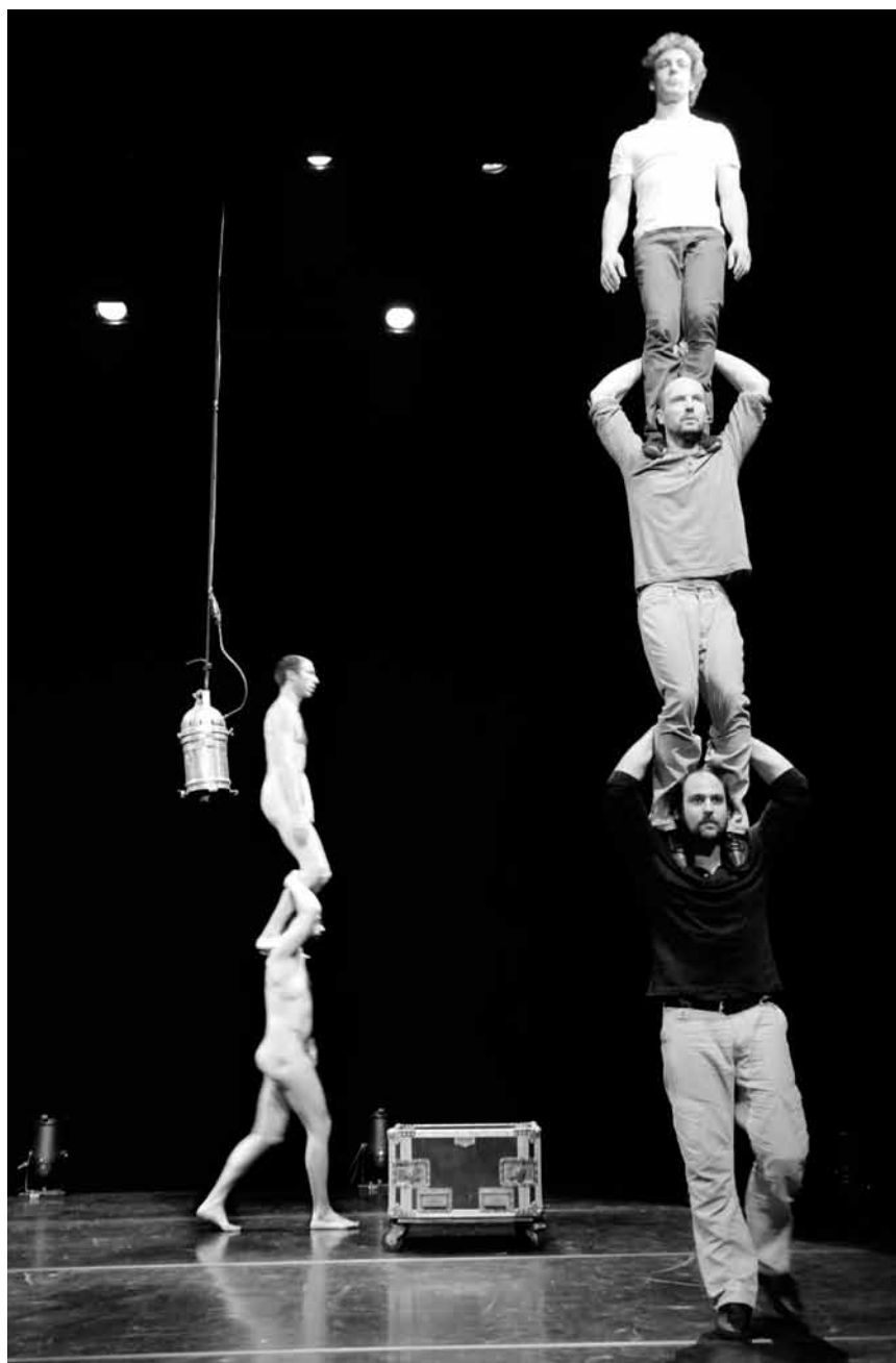
Und die, die immer noch nicht genug haben, können am 29. und am 30. Dezember die Compagnie „Sacékripa“ und ihr Stück „Coulisses“ genießen.

Harmonie Municipale Echternach , Trifolion, Echternach, 16h. Tél. 47 08 95-1.