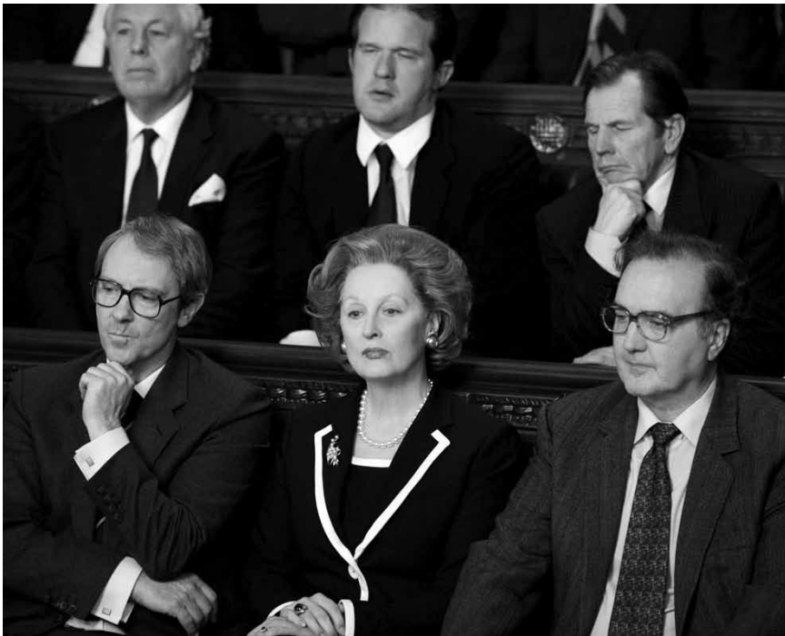
Für viele Engländer wohl eher ein Horrorstreifen: Meryl Streep im Margaret-Thatcher-Biopic „Iron Lady“, neu im Utopia.

GB 2012, gefilmte Ausstellung „Leonardo da Vinci: Maler am Mailänder Hof“. 105'. O-Ton engl., fr. Ut. Wiederholung der Live Übertragung aus der National Gallery, London.