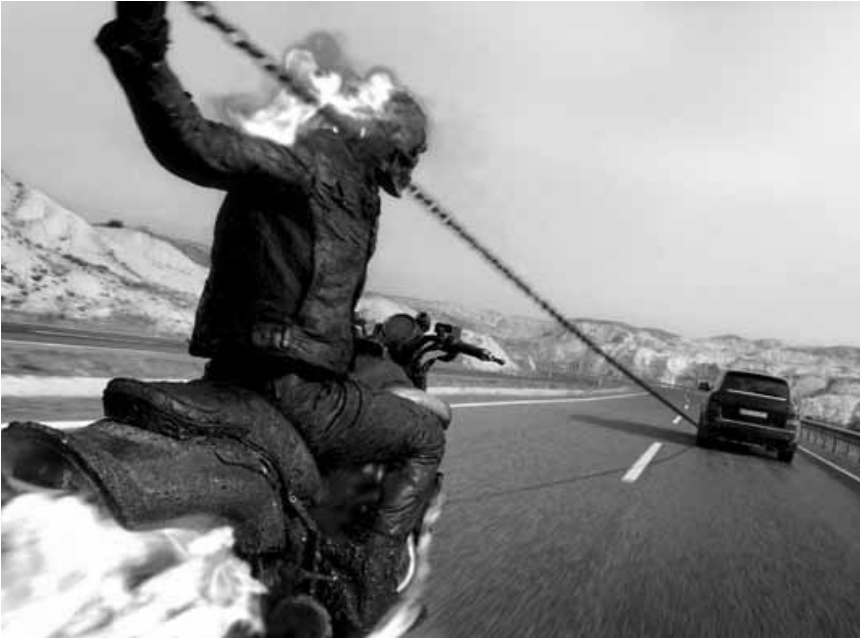
Auch amerikanische Superhelden können nach Osteuropa delokalisiert werden... wenns der Quote dient. „Ghost Rider - Spirit of Vengeance“, neu im Utopolis und CinéBelval.

Kursaal, So. 20h. Siehe unter Luxembourg.