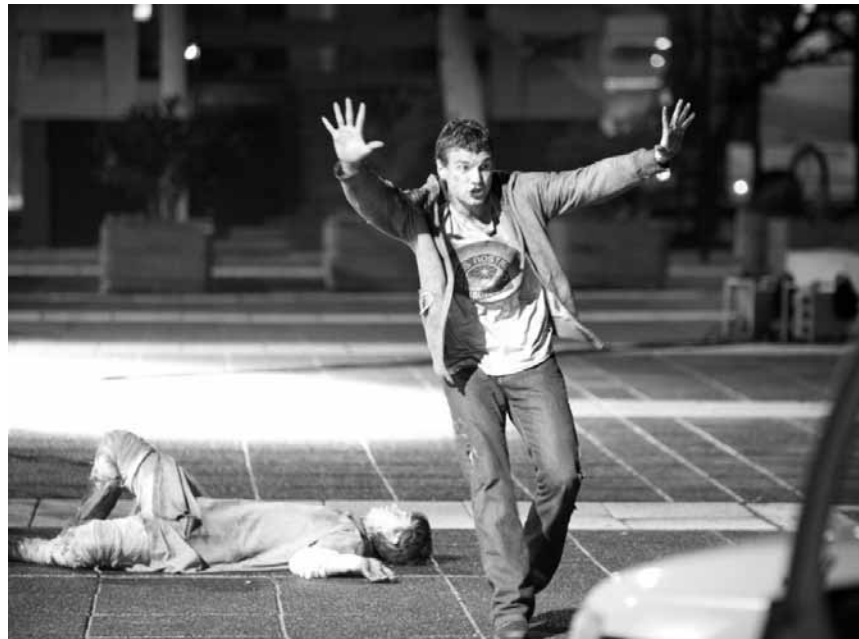
Auch Superkräfte schützen vor Dummheit nicht... „Chronicle“, neu im Utopolis und CinéBelval.

Mumble, der Pinguin hat ein Problem. Obwohl er Meister im Stepptanz ist, himmelt sein Sohn Erik den großen Sven an, der einzige Pinguin, der fliegen kann. Mit diesem neuen Vorbild kann Mumble nicht konkurrieren.