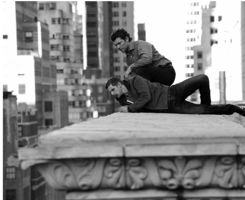
Steht nicht nur am Rande eines Wolkenkratzers, sondern auch mitten im Zentrum einer üblen Verschönerung: Sam Worthington in „Man on a Ledge“, neu Utopolis und CinéBelval.

Nick Cassidy steht im 21. Stock des New Yorker Roosevelt Hotel auf dem