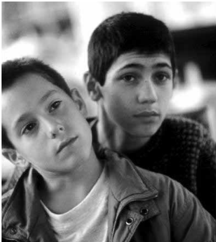
Une le  on de vie importante pour un jeune gar  on perturb   : « La classe de neige », de Claude Miller, vendredi    la Cin  math  que.

Antoine Doinel a finalement   pous   Christine. Leur vie dans un quartier populaire est berc  e par les m  tiers