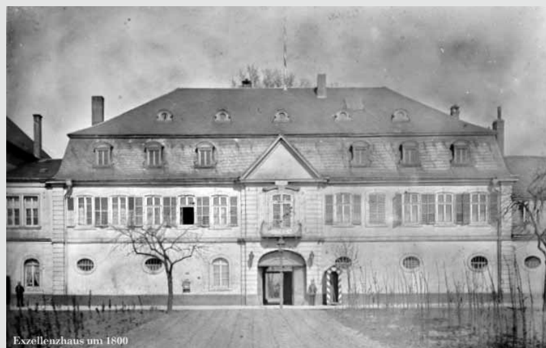
Exzellenzhaus um 1800

In diesem Sommer feiert das Exhaus sein 40-jähriges Bestehen und es wird unter anderem zu diesem Anlass in einer Fotoausstellung in all seinen Facetten und im Wandel der Zeit gezeigt. Um dies in einer anschaulichen, und repräsentativen Spannweite so interessant und unterhaltsam wie möglich zur Schau zu bringen, wird eine möglichst große Auswahl an Fotografien von Veranstaltungen, Schnappschüssen und dem Gebäude selbst, von der Nachkriegszeit bis heute benötigt. Auf den sorgsam Umgang mit den Fotos wird geachtet und sie werden nach der Ausstellung selbstverständlich zurückgesandt. Die Fotos bitte per Post oder E-Mail an: Exzellenzhaus e.V., Zurmaierstr. 114, 54292 Trier, kulturbuero@exhaus.de Rückfragen unter Tel. 0049 651 9 91 10 83