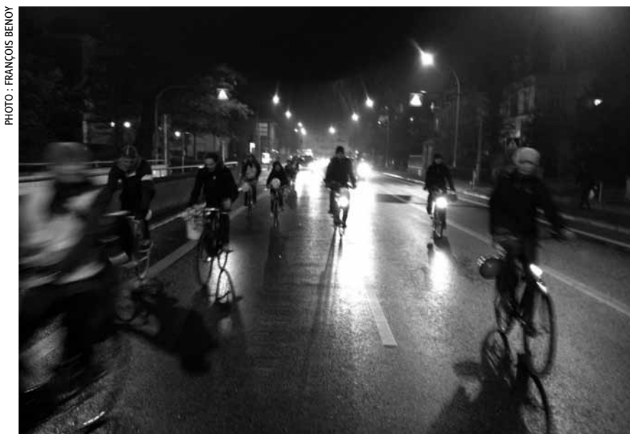
Critical Mass, le rendez-vous des cyclistes chaque dernier vendredi du mois. La photo date de novembre, mais le 30 mars, à 18 heures, il fera encore clair... et beau!