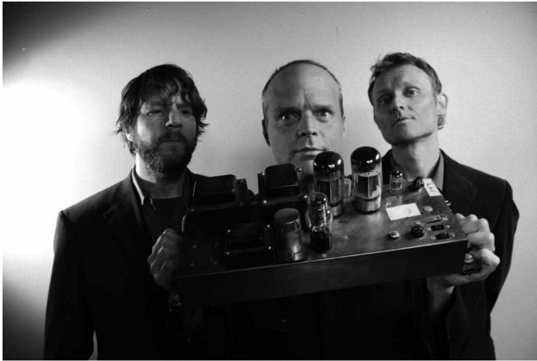
Erfinden den Jazz neu: Medeski, Martin & Wood.