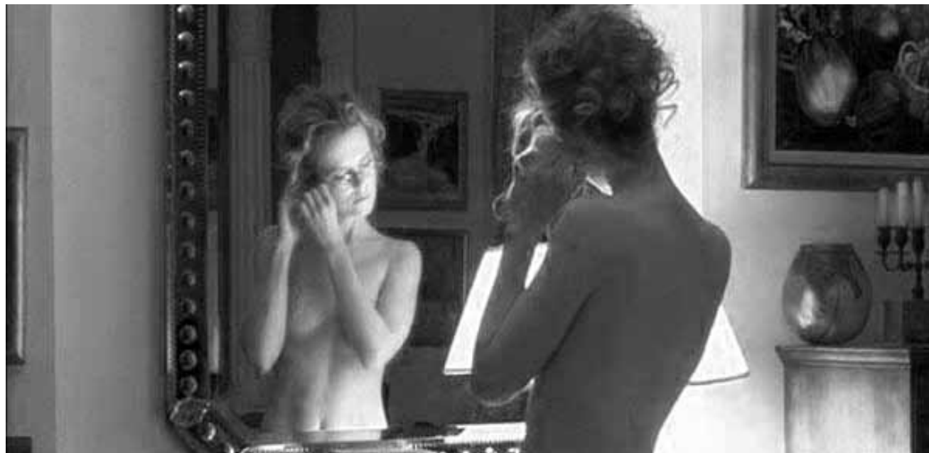
„Eyes Wide Shut“: Stanley Kubricks Vermächtnis mit dem damaligen Hollywood-Traumpaar Nicole Kidman und Tom Cruise, zeigt die Cinémathèque am Sonntag.

Margaret trompe son mari avec Max, un chimpanzé, dans un logement qu'elle loue. Le mari propose d'accueillir le singe au domicile conjugal. Max fait une fugue, revient et provoque divers scandales. Il est désormais entré dans la vie de Margaret.