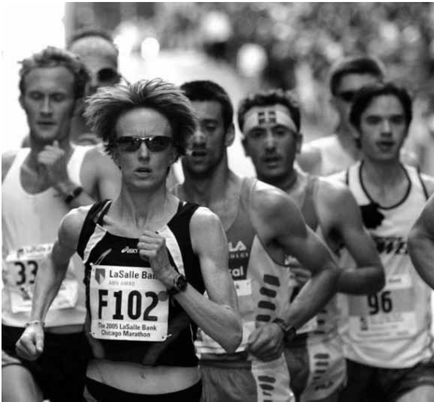
Pour les sportifs et ceux qui croient l'être : projection spéciale de « The Spirit of Marathon », vendredi à l'Utopolis, dans le cadre du ING-marathon en présence du réalisateur Jon Dunham.

The Spirit of Marathon USA 2007, documentaire de Jon Dunham. 104'. V.o. A partir de 6 ans. Dans le cadre du ING-Marathon 2012. En présence de Jon Dunham.