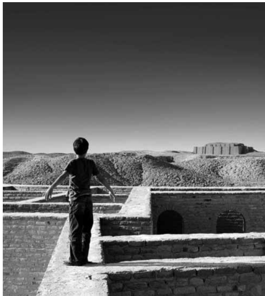
Donner un visage aux deux guerres du Golfe surmédiatisées, c'est l'idée de « Son of Babylon », Cinédit mercredi et jeudi à l'Utopia.

De syldivesche Schachweltmeester gëtt vun der lëtzebuergercher Spillerin Sophie Latour geschloen. Mat Hëllef vun engem revolutionäre Quantecomputer well hien seng Revanche géint si huelen. Awer den Informatiker Max, deen d'Software esou programmiert, datt se d'Sophie besser schachmatt setze kann, verléift sech an si. Dës Geschicht fantaséiert sech de Roger während sengem Openthalt am Multi-komplex „L'Âge d'Or“ zuesammen. „Dem Roger seng zuesammefantaséiert Geschicht huet hire Charme, mee leider ass awer säin Openthalt am Pflegeheim zevill onrealistesche gefilmt. (lg)