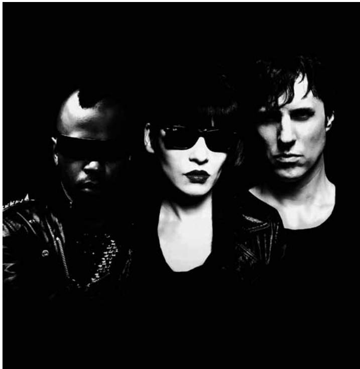
Au service de la révolution depuis 1992 : Atari Teenage Riot.