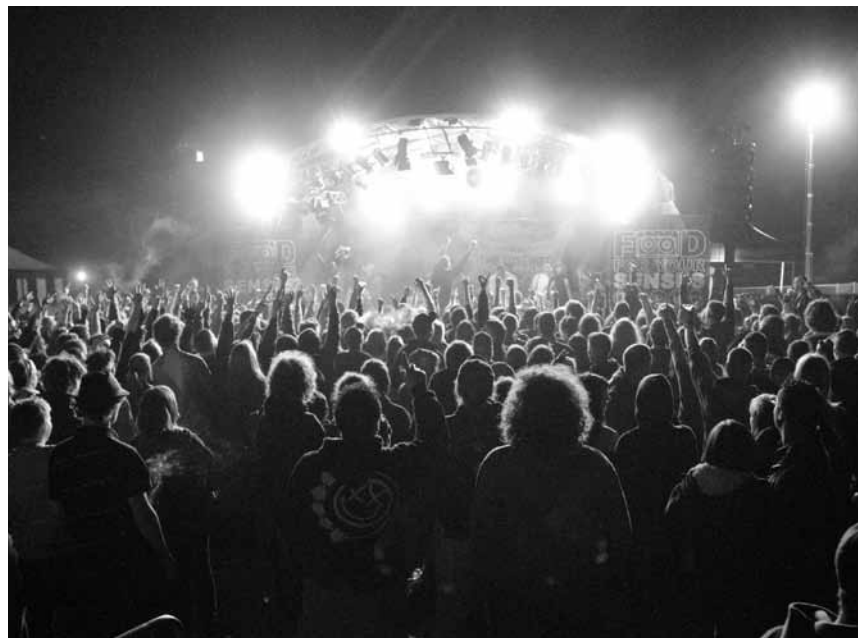
Das Food For Your Senses-Festival in Tuntange bietet jedes Jahr mehr Nahrung für die Ohren, am 25. Mai geht es los.

Der Gott des Gemetzels, von Yasmina Reza, Saarländisches Staatstheater, Saarbrücken (D), 19h30. Tel. 0049 681 30 92-0.