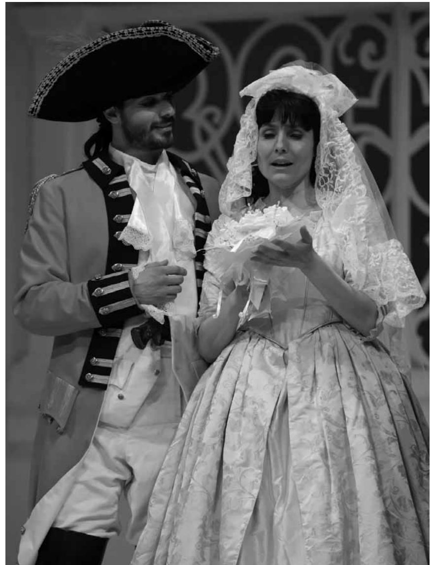
Große Gefühle im Centre culturel Kinneksbond: „Der Barbier von Sevilla“, Oper von Gioacchino Rossini, am 14. Mai in Mamer.