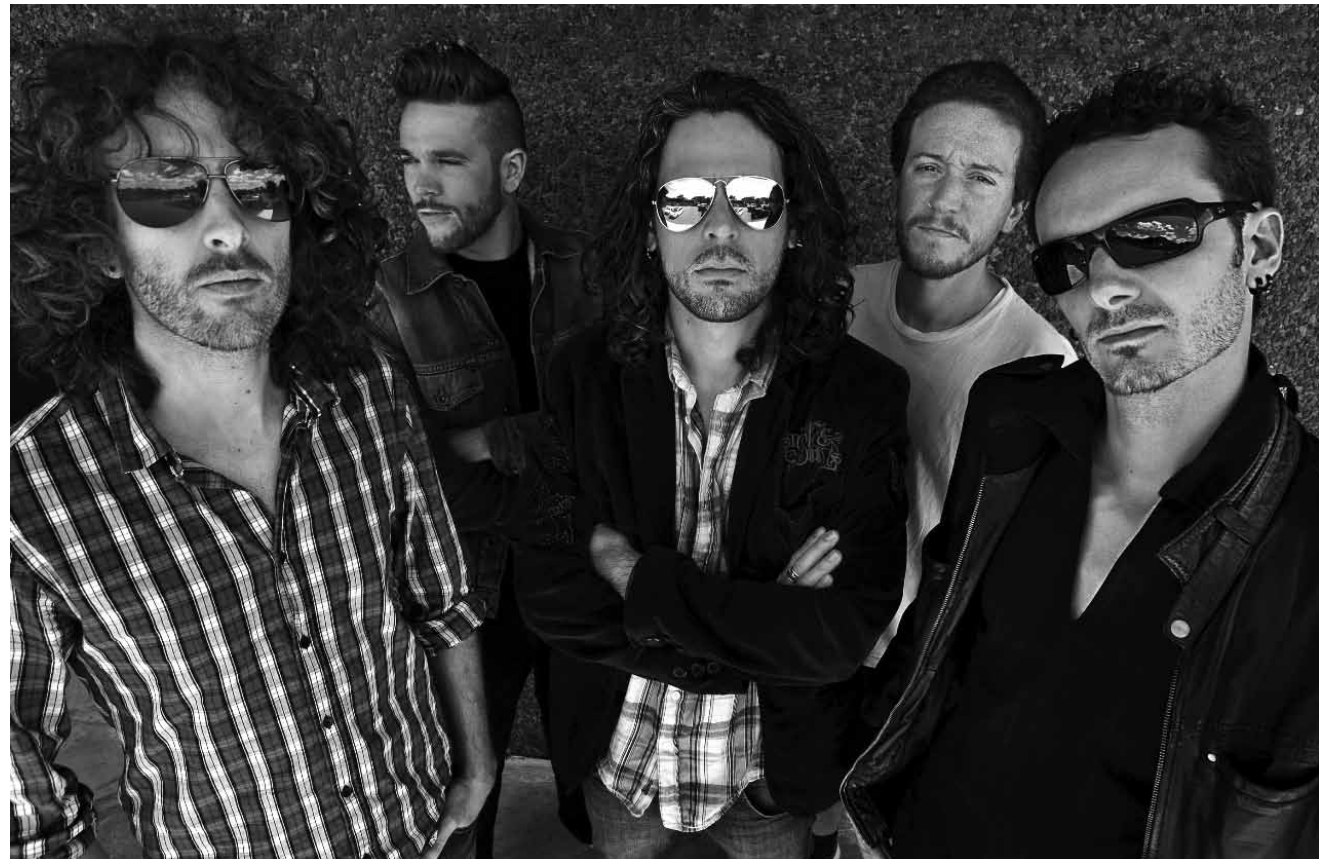
Les « Rammstein à la française » de Sidilarsen seront aux Trinitaires de Metz le 15 mai, en avant-programme : Tess.