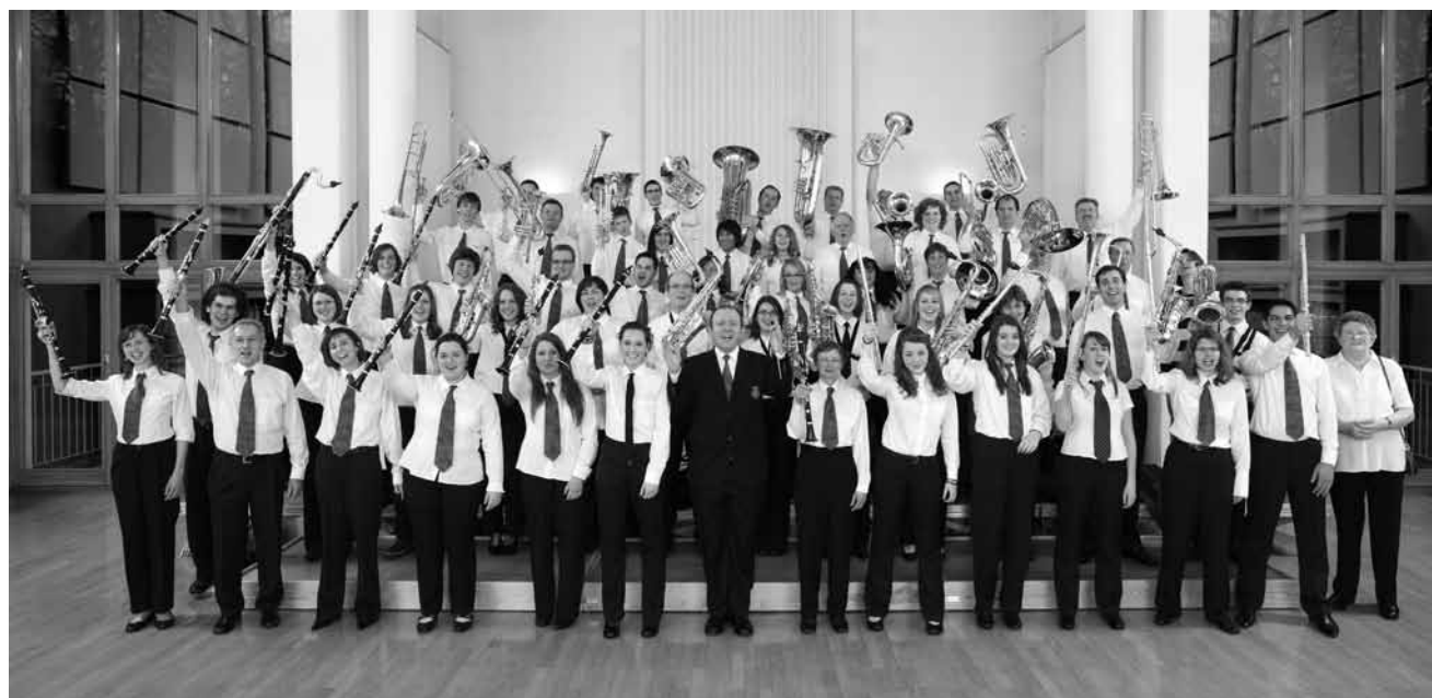
« L'opera in coro », les chœurs célèbres d'opéras italiens seront en tournée en Grande Région : le 11 mai au Casino 2000 de Mondorf, le 12 mai à l'église Saint-Martin de Maizières-les-Metz et le 20 mai à l'Arsenal de Metz.

Cie La Serrana , flamenco, Kulturfabrik, Grande Salle, Esch , 20h. Tél. 55 44 93-1. Dans le cadre du 7e Flamenco Festival.