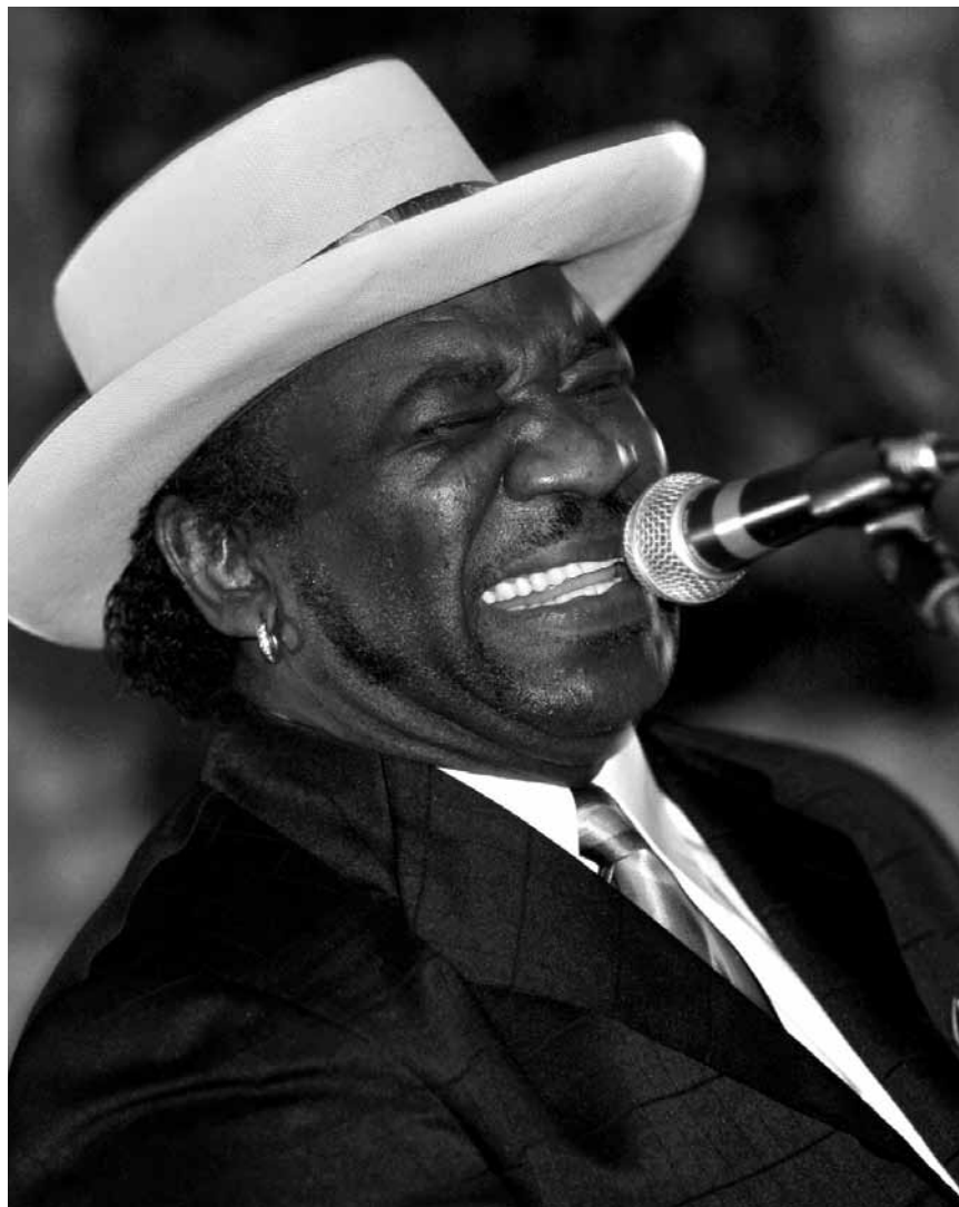
En direct de Chicago, avec le meilleur du blues : Eddy « The Chief » Clearwater, sera au Sang a Klang le 1er juin.