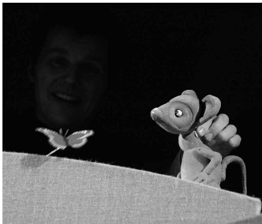
Beim Marionettenfestival in Tadler lässt man am 26., 27. und 28. Mai die Puppen tanzen.

James Morrison , Rockhal, Club, Esch , 21h.