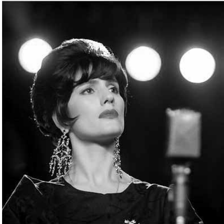
Une femme qui - en passant par la tradition du fado - innove les mentalités de son pays : « Amália », ce mardi à l'Utopolis, dans le cadre du festival du film portugais.

Wiltz / Prabbeli 2 Days in New York American Reunion Dark Shadows Hanni und Nanni 2 The Avengers The Dictator