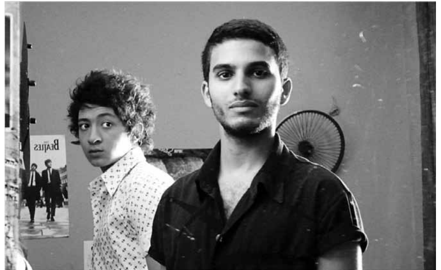
« Le fils de l'autre », raconte l'histoire de deux enfants intervertis à leur naissance dans le cadre du conflit du Proche-Orient, Cinéclub ce jeudi au CinéBelval.

Zauberspiegel ist nicht länger sie, sondern ihre Stieftochter Schneewitt- chen die Schönste im ganzen Land. Sie fackelt nicht lange und verbannt das bildhübsche Schneewittchen kurzerhand in einen finsternen Wald, wo diese von sieben kleinwüchsigen Kleinkriminellen, liebevoll aufgenom- men wird.