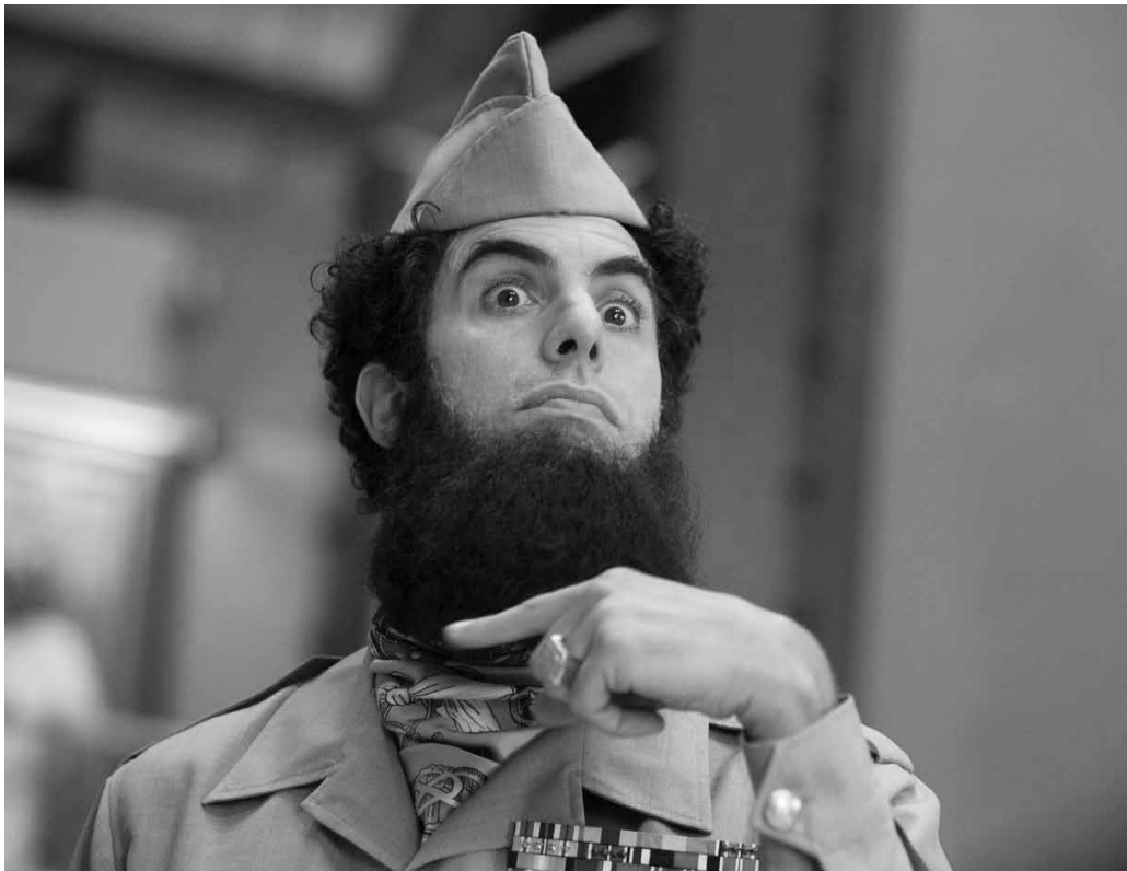
Son geste préféré...