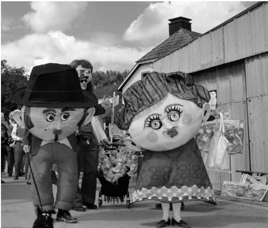
Den 23. Juni steet e ganzt Duerf nees um Kapp, um 22. Open Air Konschtfestival zu Lellgen gëtt et alles fir grouss a kleng.

Galerie du Moulin (tél. 99 86 16), jusqu'au 30.6, me. - lu. 14h - 18h.