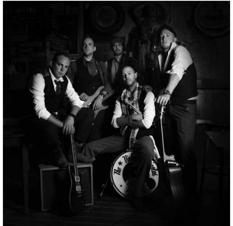
They're not just Gigolos, they're „Vintage Gigolos“... und spielen an diesem Freitag, dem 15. Juni im Kulturhaus Niederaanven, zusammen mit „Lompekreimer“ und „Täschegas“.