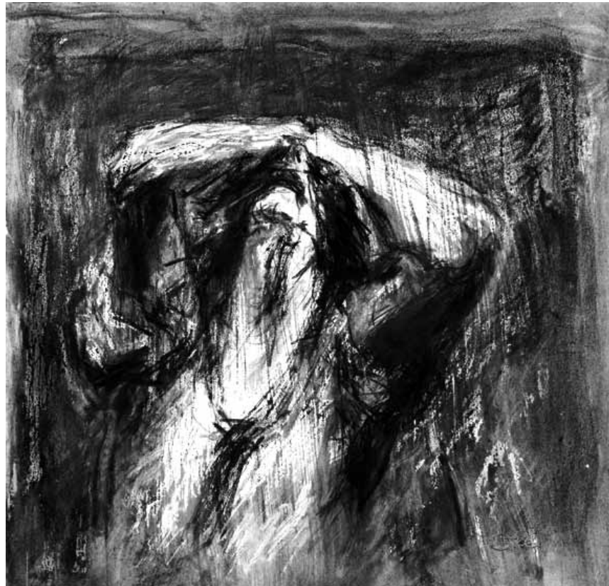
La liberté comme thème principal de l'exposition courante au Musée national de la Résistance qui dure jusqu'au 11 novembre.