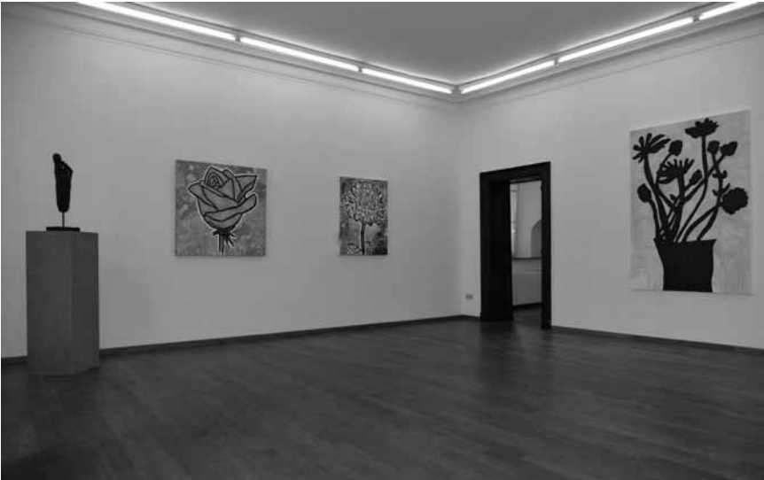
Donald Baechler puise dans la culture pop art pour son expo à la Galerie Nosbaum & Reding jusqu'au 22. septembre.

photographies, Galerie d'exposition de l'Arsenal (avenue Ney, tél. 0033 3 87 39 92 00), jusqu'au 26.8, ma. - sa. 13h - 18h, di. 14h - 18h. Fermé les jours fériés.